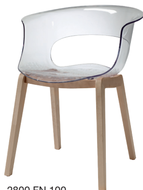
2800 FN 100

Scocca in policarbonato antishock. Telaio in faggio. Un prodotto adatto a molteplici ambienti, ideale sia per uso domestico che in locali pubblici. Disponibile anche nella versione con cuscino tessile fisso applicato al sedile.