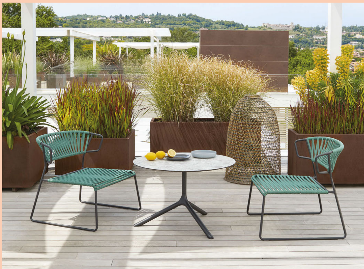
Lounge armchair Poltrona Lisa Lounge Filò, art. 2878

Zinc and polyester powder coated steel frame, braided in nautical rope.