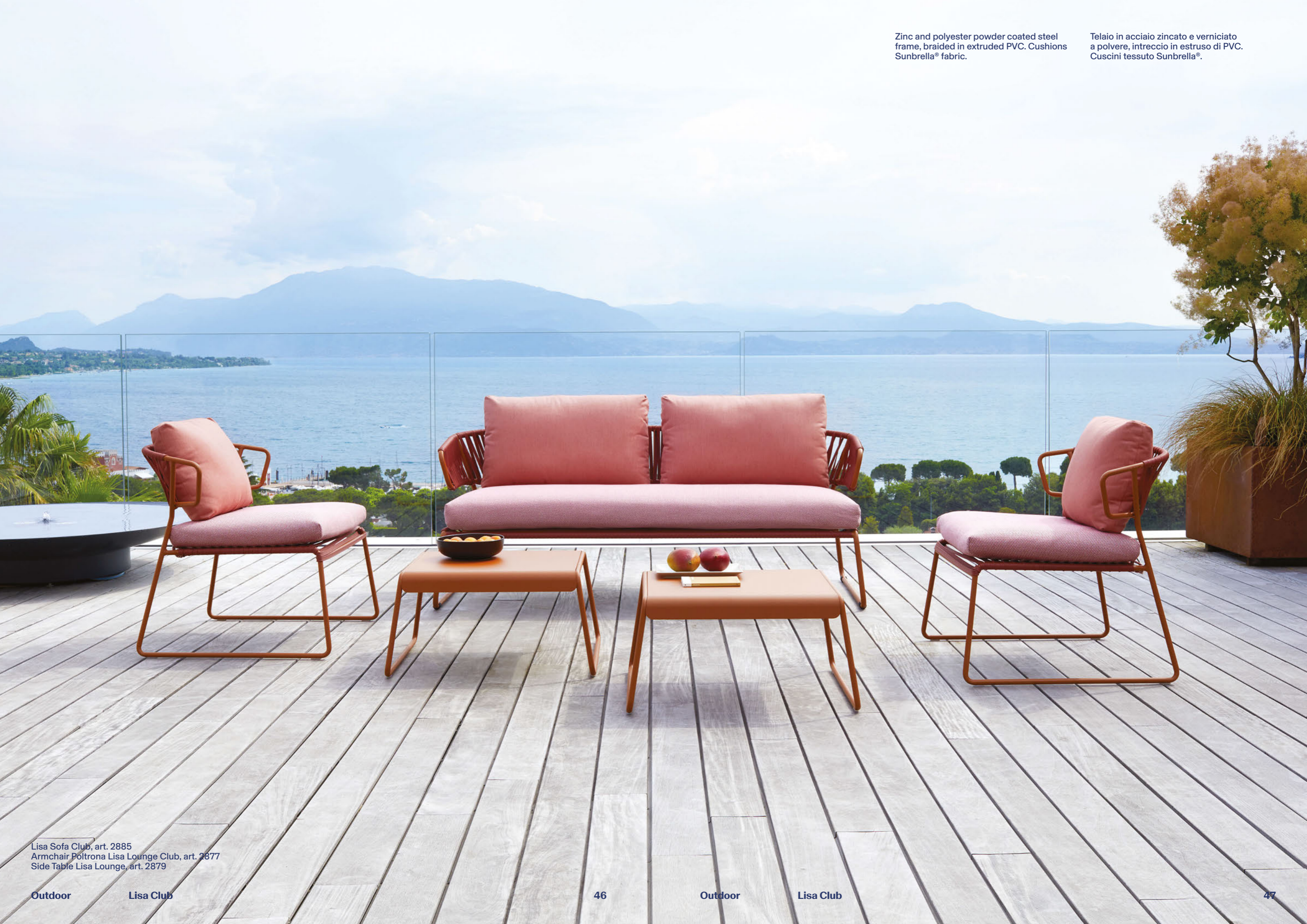
Lisa Sofa Club, art. 2885 Armchair Poltrona Lisa Lounge Club, art. 2877 Side Table Lisa Lounge, art. 2879

Telaio in acciaio zincato e verniciato a polvere, intreccio in estruso di PVC. Cuscini tessuto Sunbrella®.