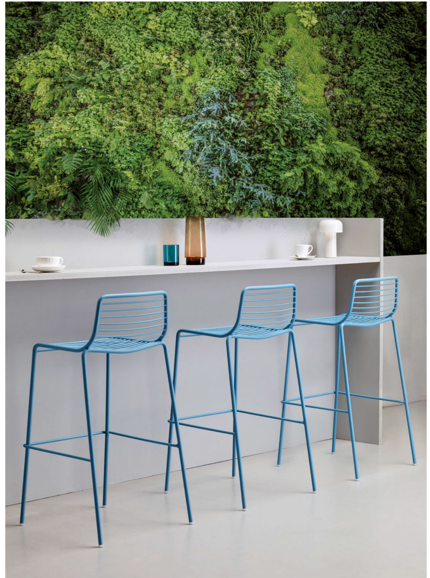
Stackable barstool Sgabello impilabile Summer, art. 2535 h.75

Struttura in acciaio zincato e verniciato a polvere.