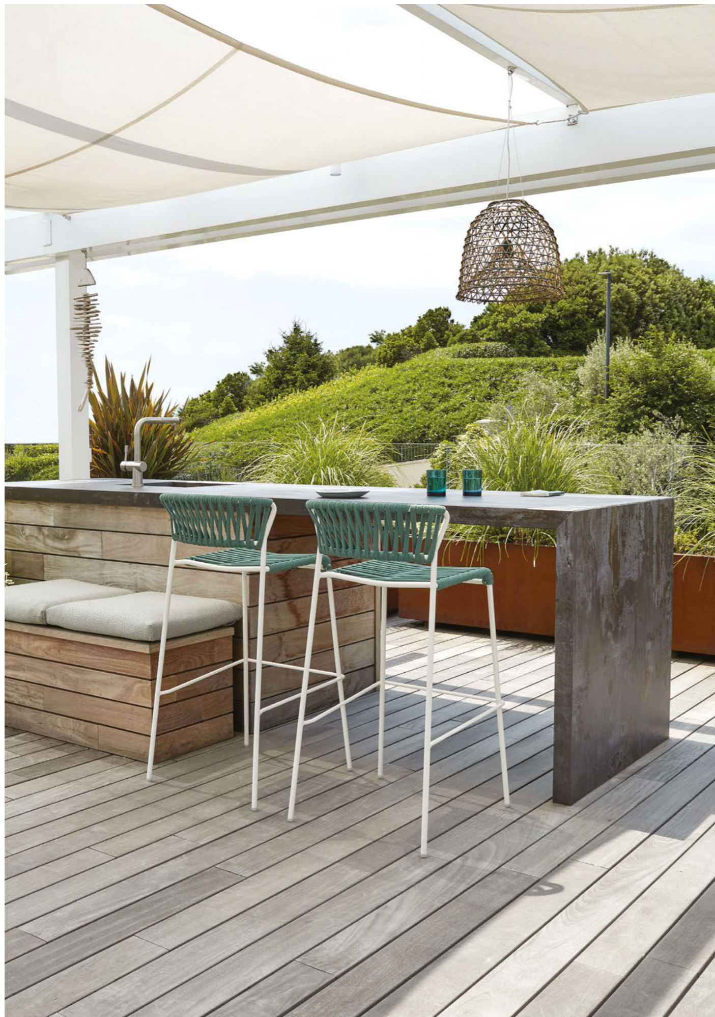
Barstool Sgabello Lisa Filò, art. 2871 h.75