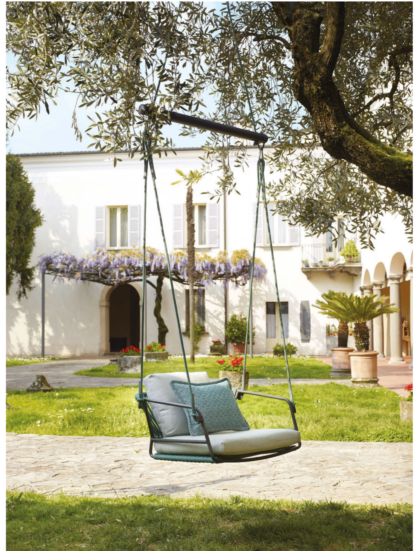
Hanging armchair Seduta Sospesa Lisa Swing, art. 2883

Telaio in acciaio zincato e verniciato a polvere, intreccio in corda nautica. Optional: cuscini tessuto Sunbrella®.