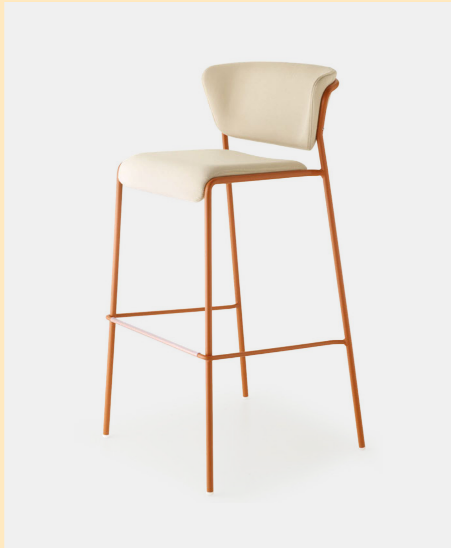
Barstool Sgabello Lisa Waterproof, art. 2862 h.75