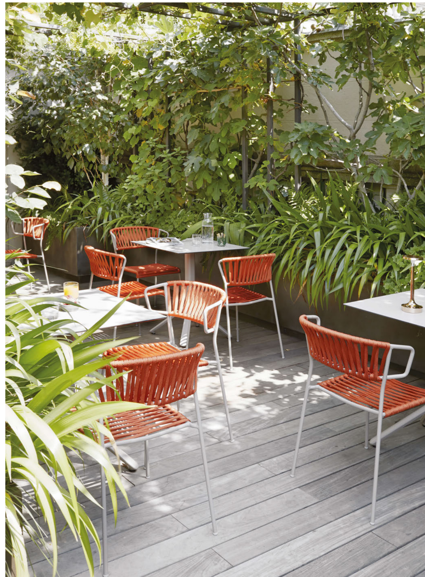
Chair Sedia Lisa Filò, art. 2870 Armchair Poltrona Lisa Filò, art. 2869

Telaio in acciaio zincato e verniciato a polvere, intreccio in corda nautica.