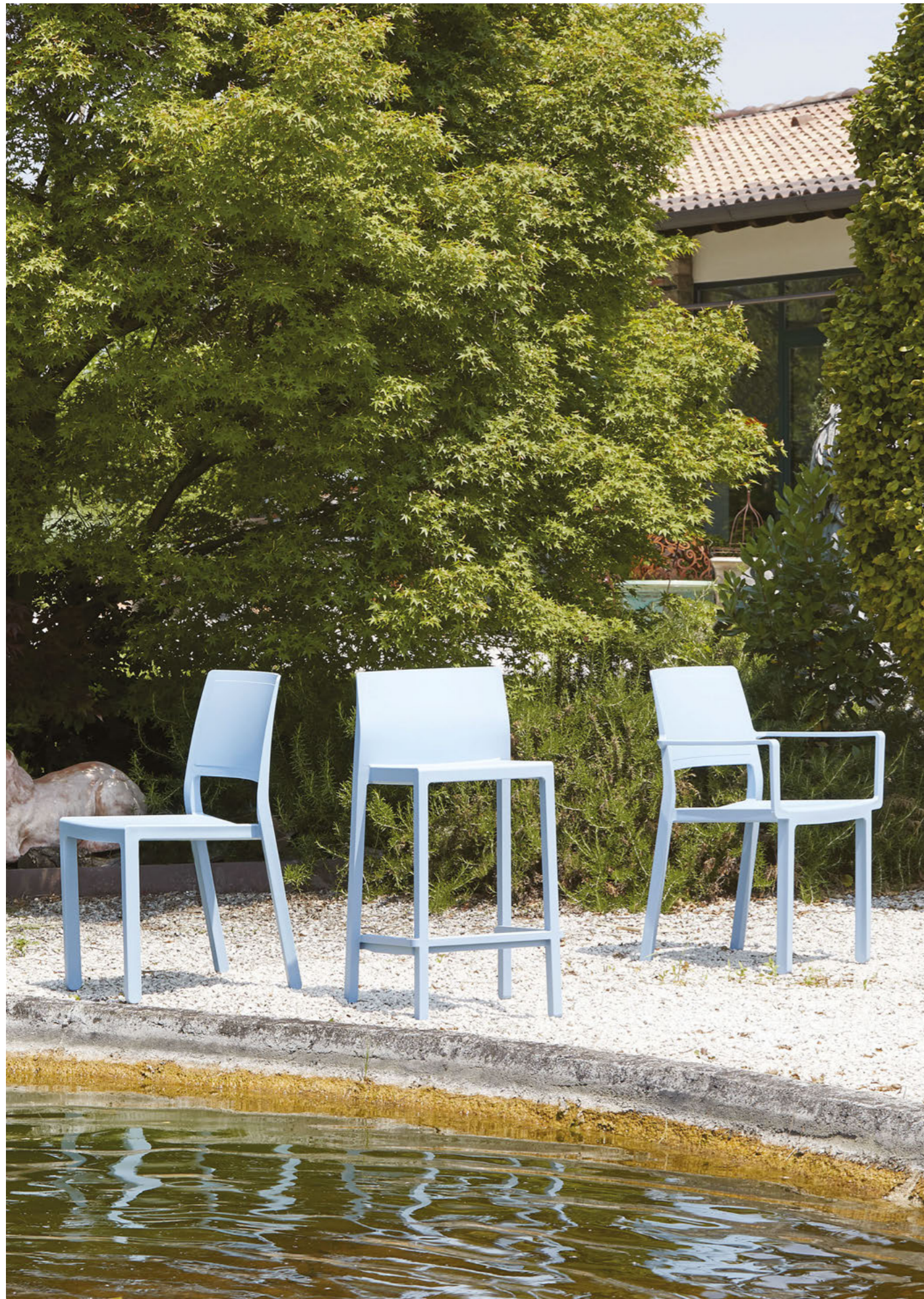
Stackable barstool Sgabello impilabile Kate, art. 2346 h.65 Stackable armchair Poltrona impilabile Kate, art. 2340