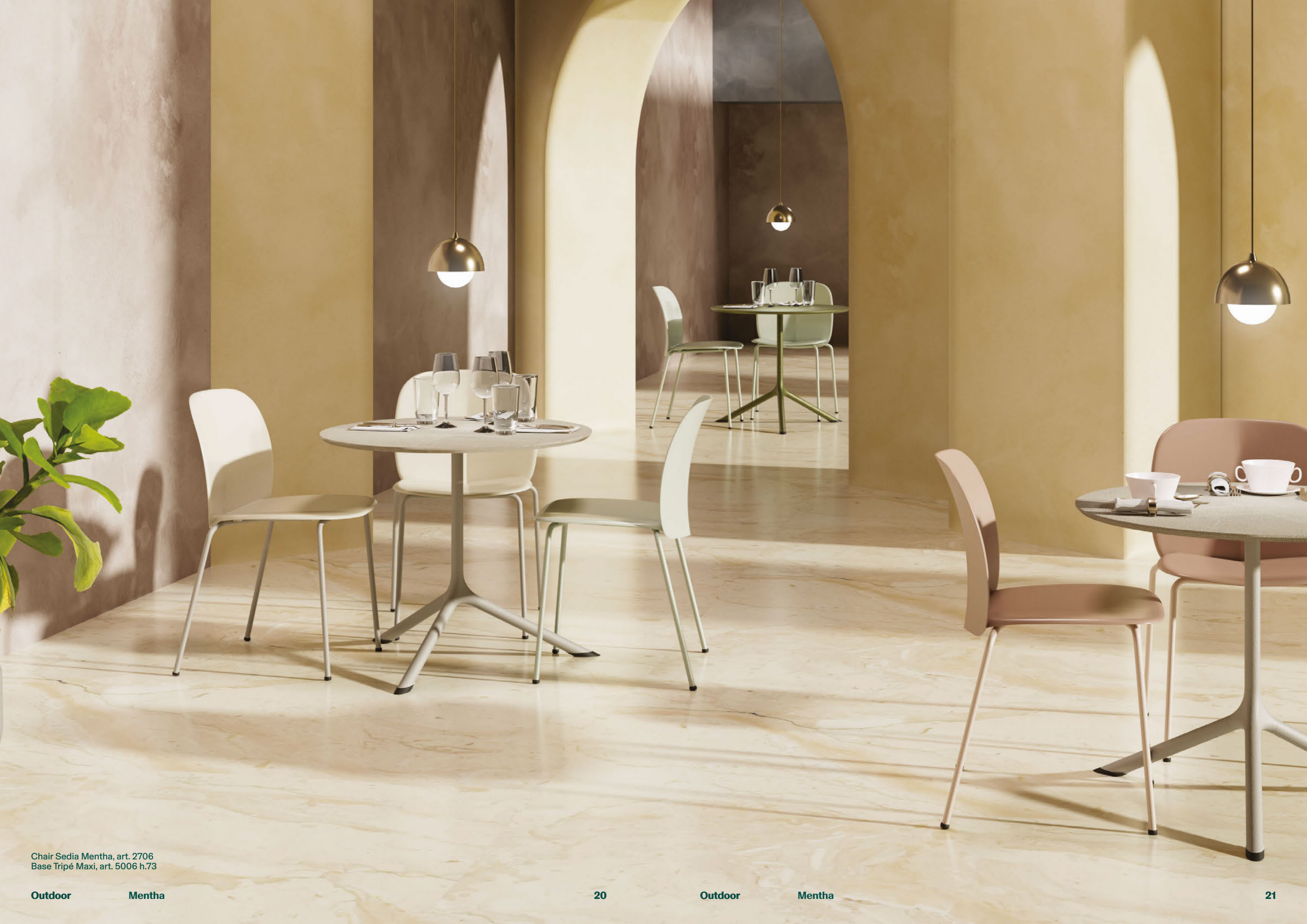
Chair Sedia Mentha, art. 2706 Base Tripé Maxi, art. 5006 h.73