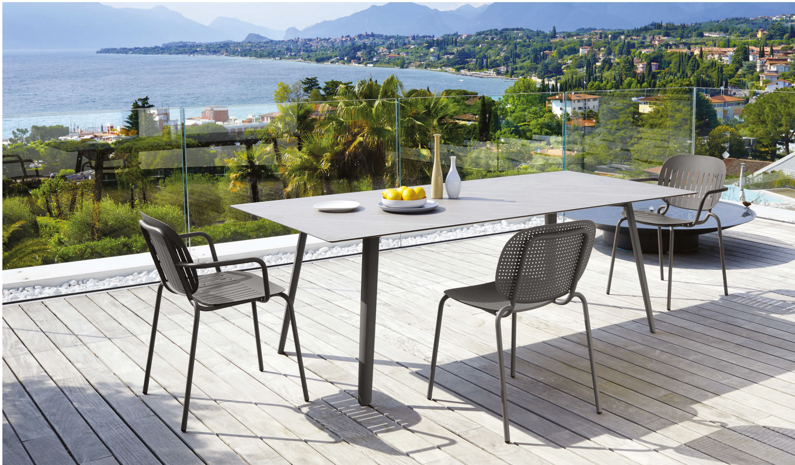
Rectangular Table Tavolo Squid rettangolare - 210x100, art. 2431 Piasentina stone effect top / Piano effetto pietra piasentina Armchair Poltrona Si-Si Barcode, art. 2507 Chair Sedia Si-Si Dots, art. 2505