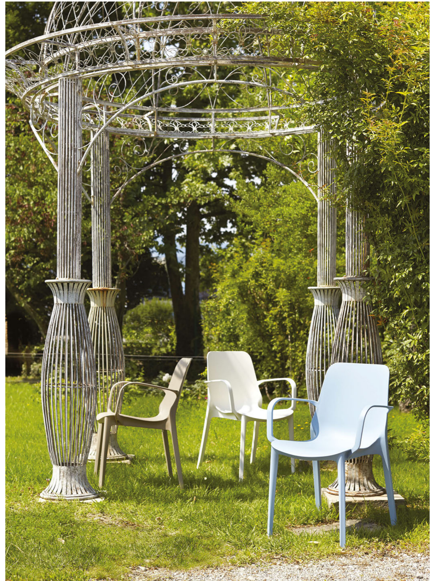
Stackable armchair Poltrona impilabile Ginevra, art. 2333

Also available in Go Green version. Disponibile anche in versione Go Green.