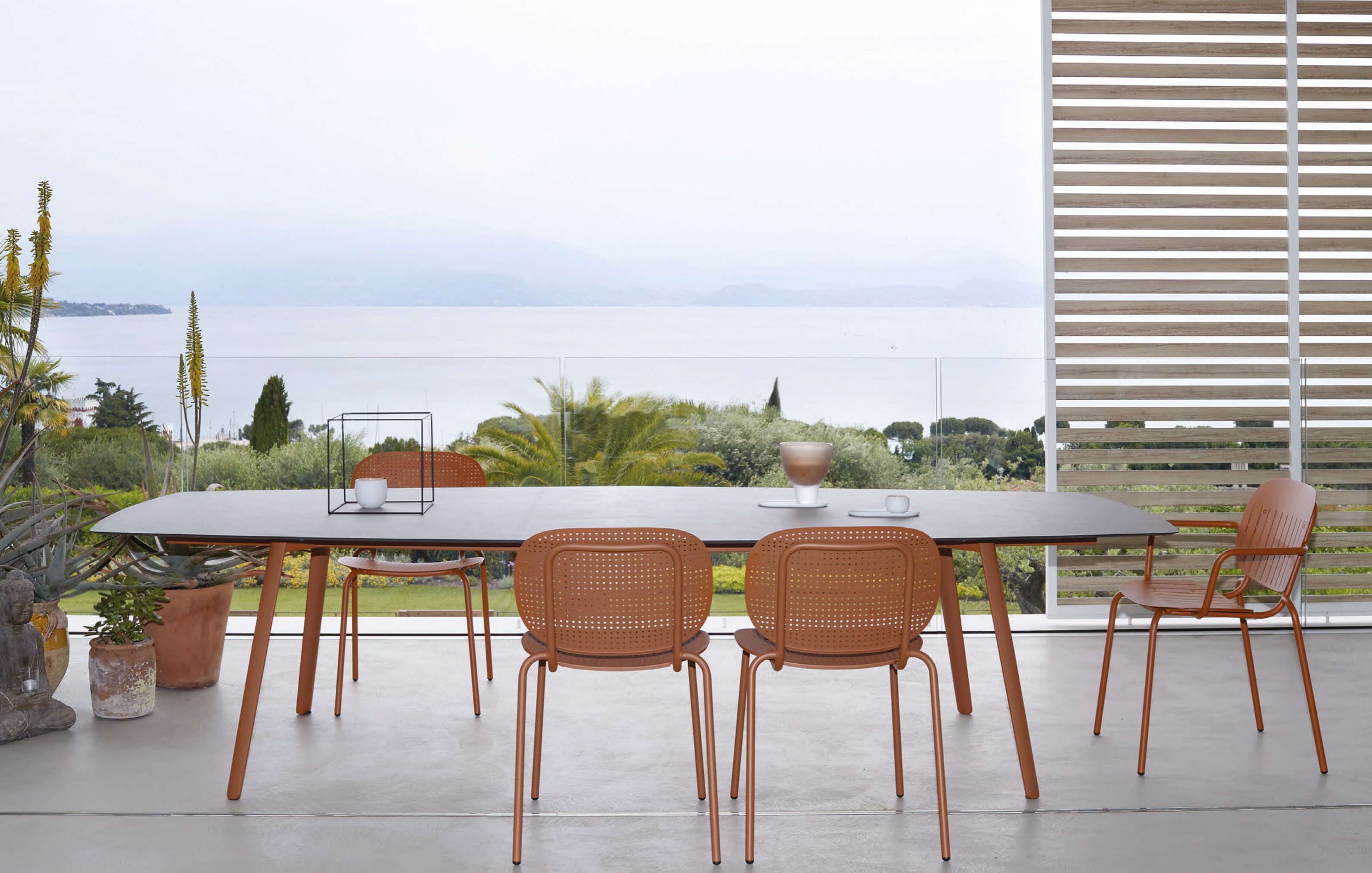
Hexagonal Table Tavolo Squid esagonale - 300x130, art.2437 Armchair Poltrona Si-Si Barcode, art. 2507 Chair Sedia Si-Si Dots, art. 2505