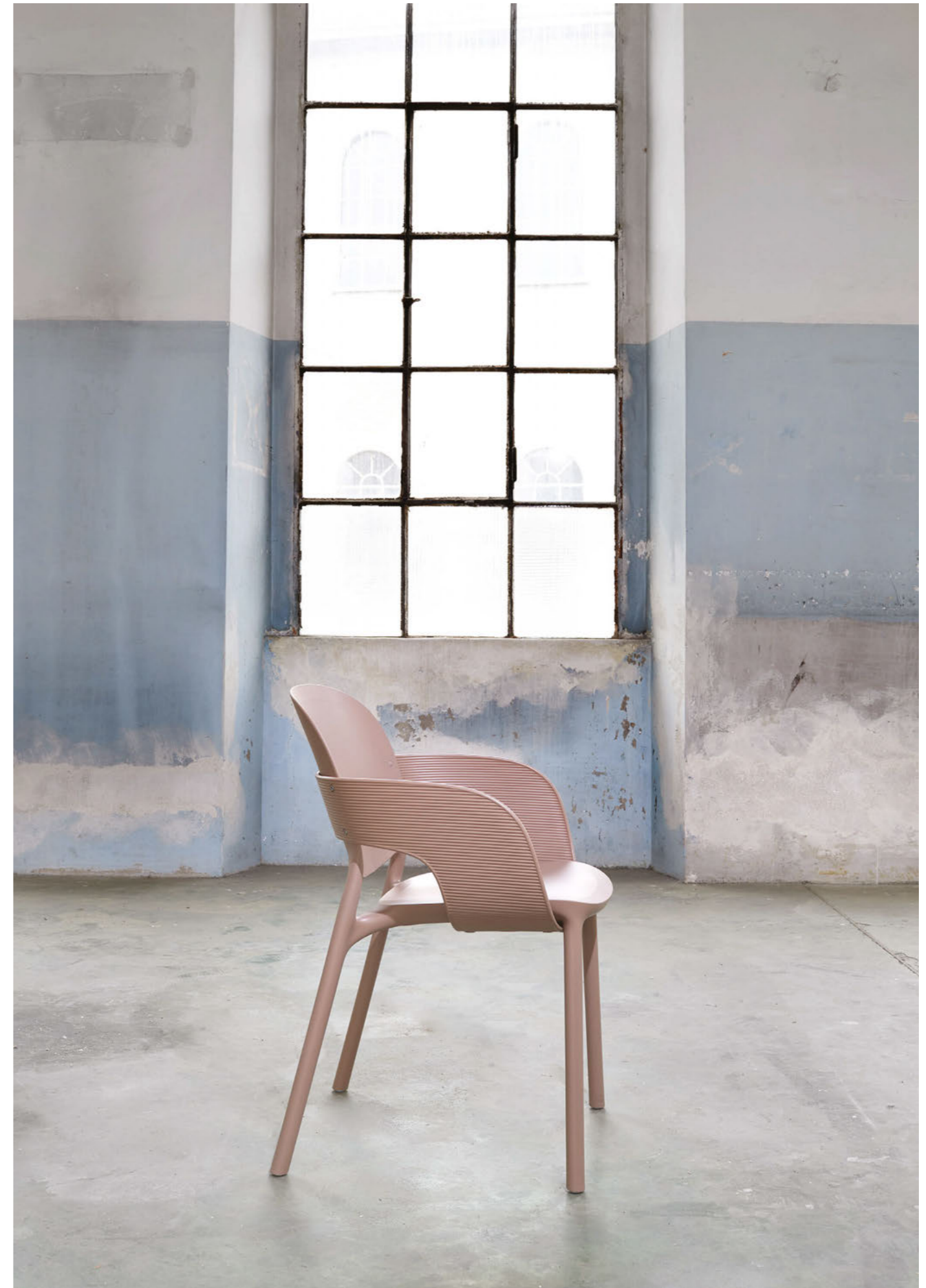
Armchair Poltrona Hug, art. 2382