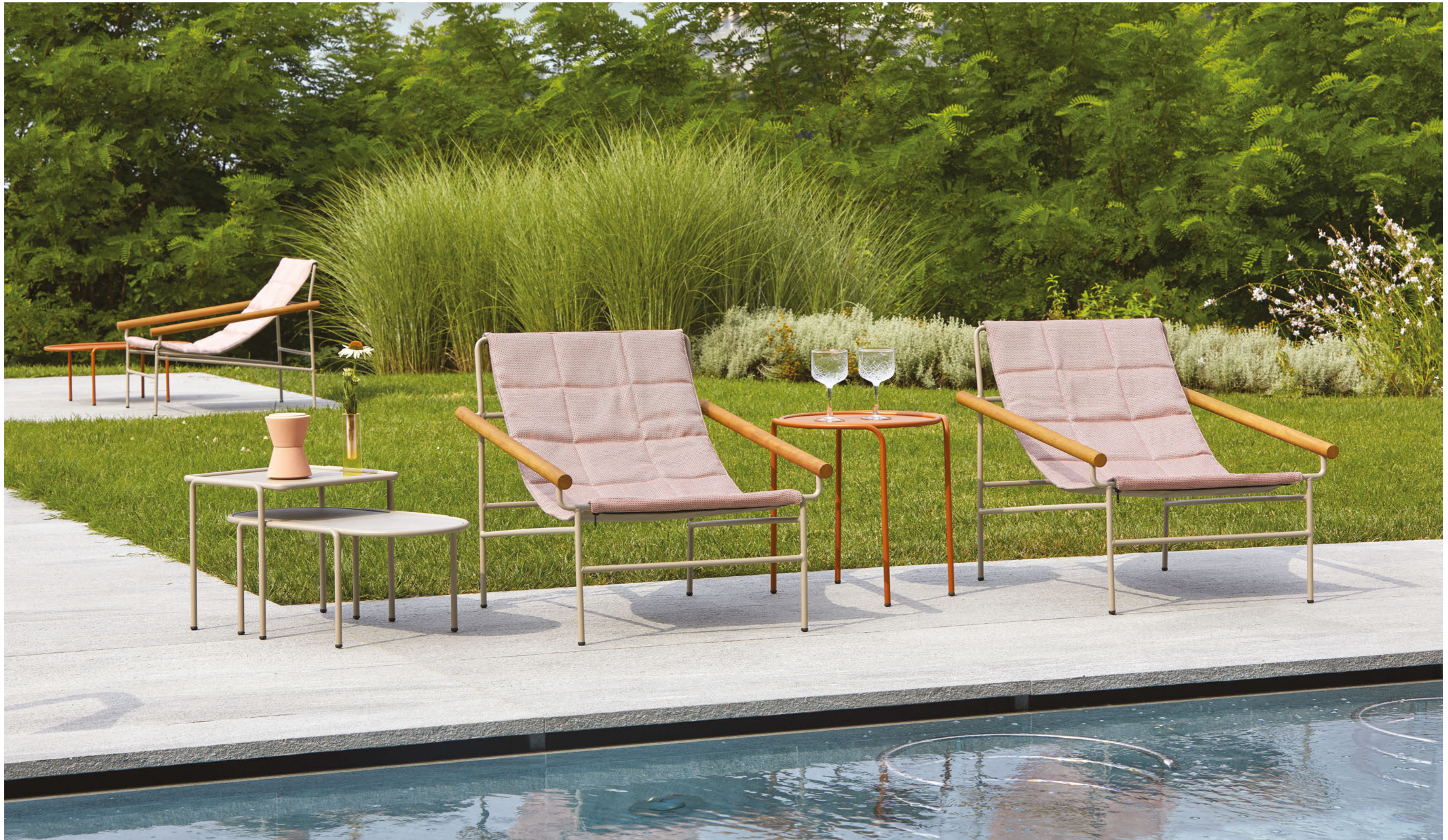
Lounge armchair Poltrona Dress_Code Glam, art. 2583 Round Coffee table rotondo Dress_Code, art. 2742 Ø 45 h.50 Oval Coffee table ovale Dress_Code, art. 2744 36x77 h.30 Square Coffee table quadrato Dress_Code, art. 2743 41x41 h.40