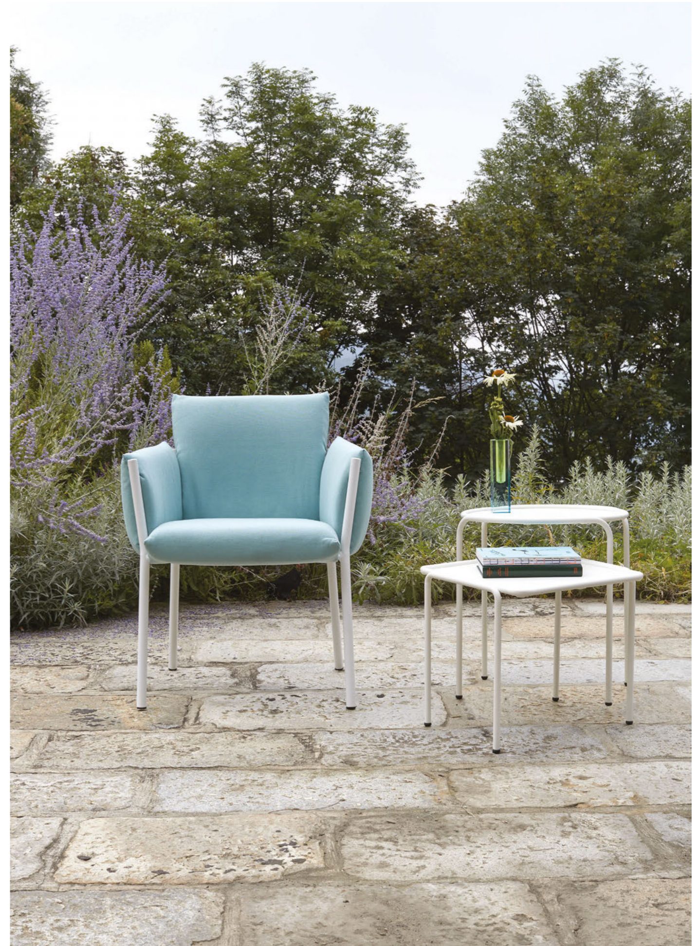
Armchair Poltrona Brezza, art. 2898 Round Coffee table rotondo Dress_Code, art. 2742 Ø 45 h.50 Square Coffee table quadrato Dress_Code, art. 2743 41x41 h.40