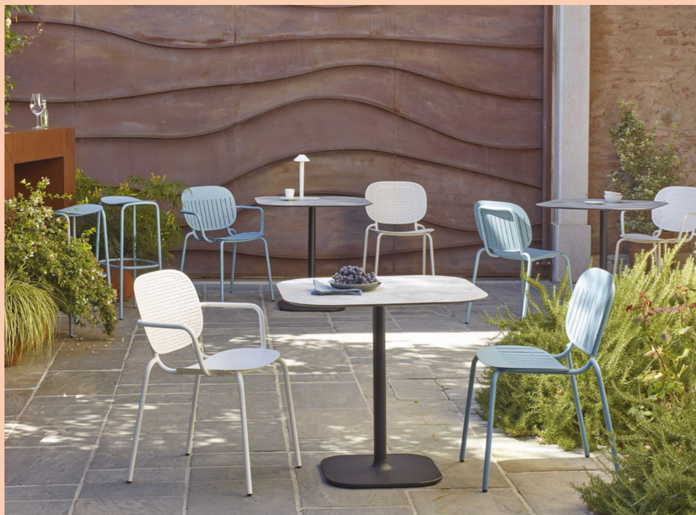
Chair Sedia Si-Si Dots, art. 2505 Armchair Poltrona Si-Si Dots, art. 2504 Chair Sedia Si-Si Barcode, art. 2508 Armchair Poltrona Si-Si Barcode, art. 2507 Base Rhino h.73, art. 5184

Zinc and polyester powder coated steel frame.