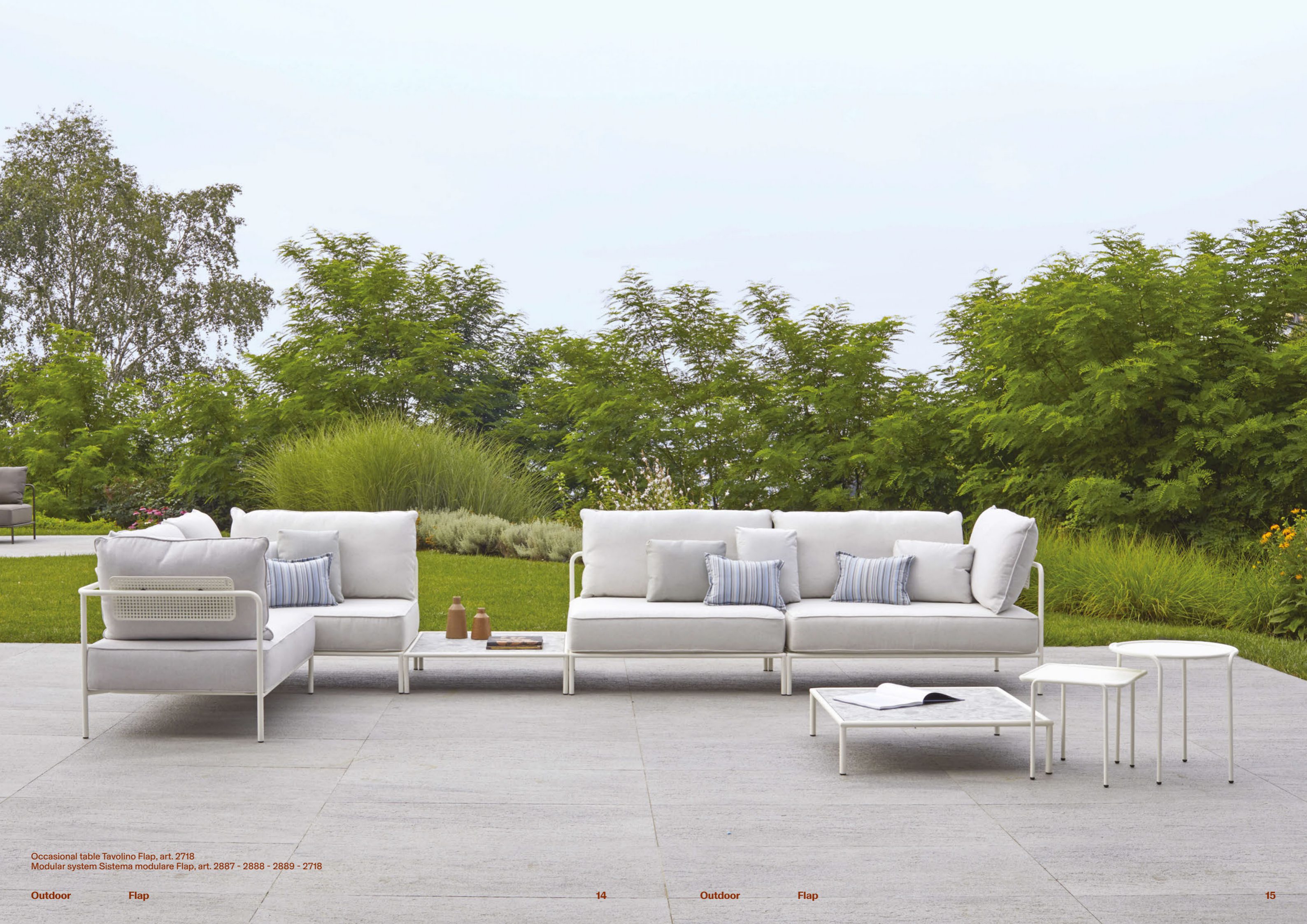
Occasional table Tavolino Flap, art. 2718 Modular system Sistema modulare Flap, art. 2887 - 2888 - 2889 - 2718