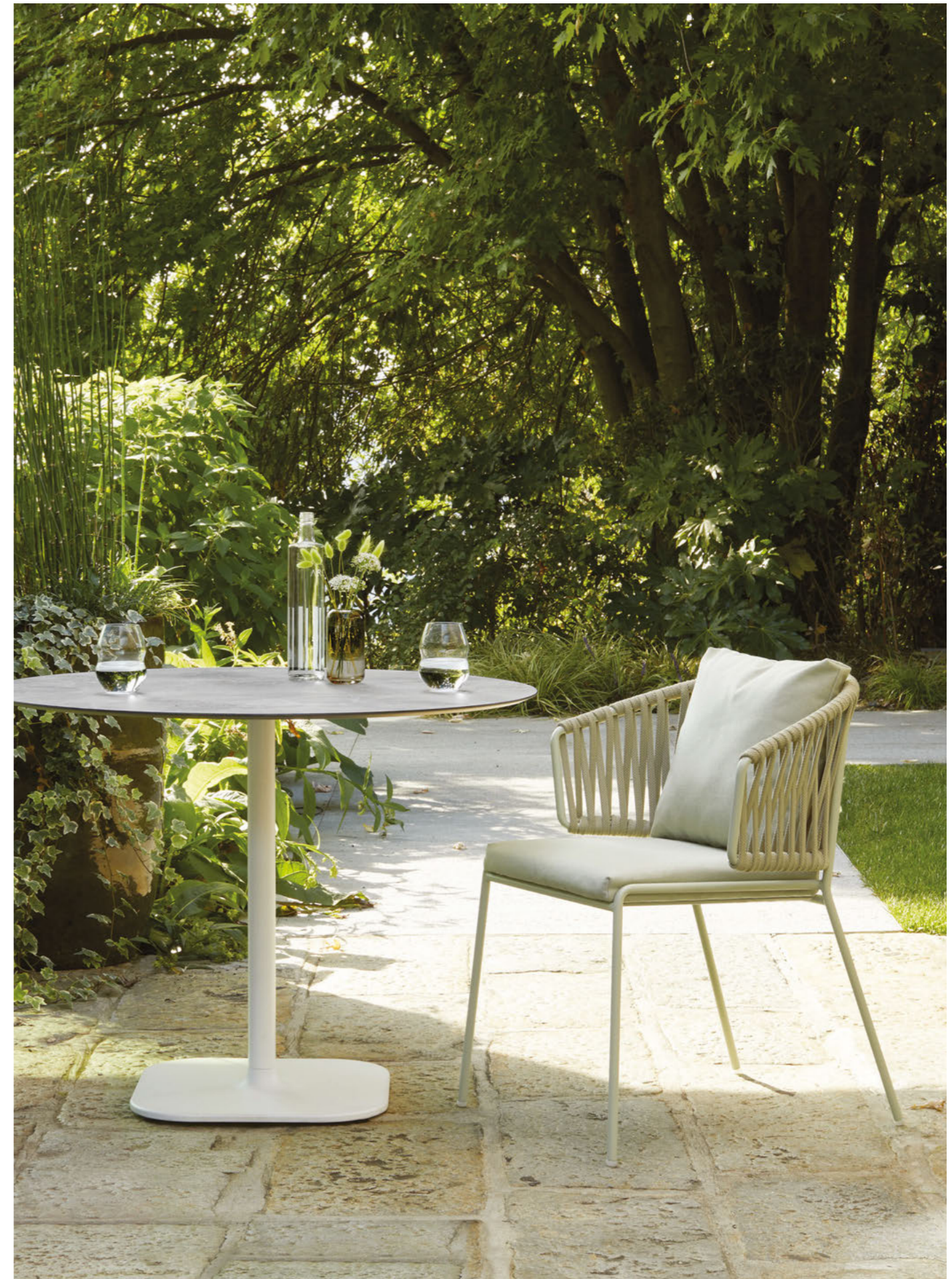
Armchair Poltrona Lisa Filò Nest, art. 2899

Telaio in acciaio verniciato a polvere, intreccio in corda nautica. Cuscini tessuto acrilico.