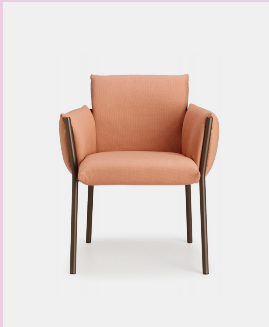
Armchair Poltrona Brezza, art. 2898

(En) The generous upholstery of Brezza leaves the round metal legs exposed, lending strength and recognisability to the armchair. The seat is incredibly practical: a simple gesture is all it takes to remove the upholstery. (It) La generosa imbottitura di Brezza lascia a vista le gambe in metallo a sezione tonda che donano forza e riconoscibilità alla poltroncina. La seduta è molto pratica: basta un gesto per sfoderare l'imbottitura.