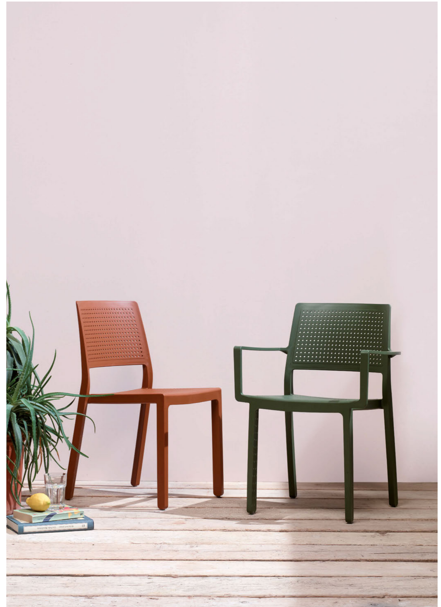
Stackable armchair Poltrona impilabile Emi, art. 2342 Stackable chair Sedia impilabile Emi, art. 2343