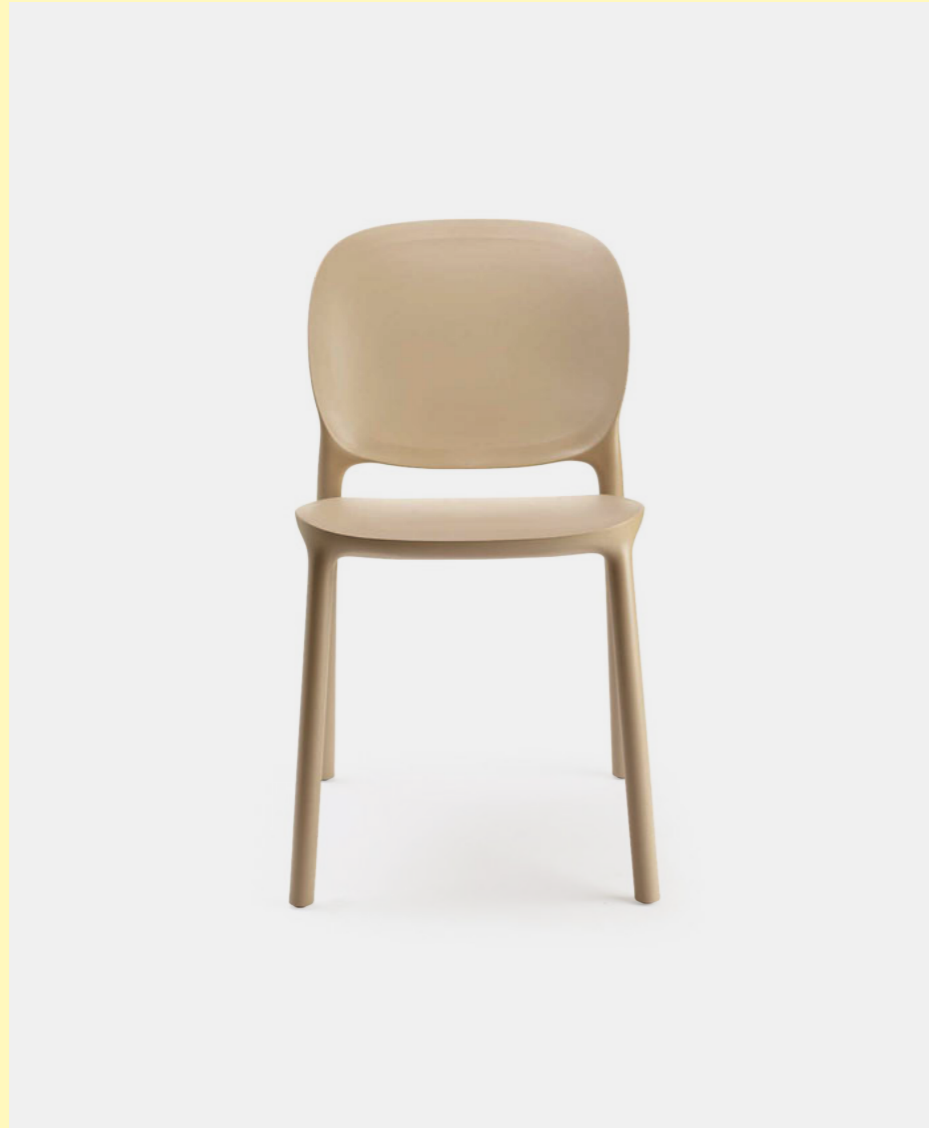
Chair Sedia Hug, art. 2380

(En) The HUG chair collection is made entirely from second-life materials. There are two variants: an all-technopolymer version, perfect for outdoor environments, and a softer one with the addition of a seat cushion and padded band covered in fabric, even more enveloping. (It) La collezione di sedute HUG è realizzata al 100% con materiali al secondo ciclo di vita. Due sono le varianti: una versione tutta in tecnopolimero, perfetta per l'outdoor, un'altra più aggraziata con l'aggiunta di cuscino di seduta e fascia imbottita e rivestita in tessuto, ancora più avvolgente.