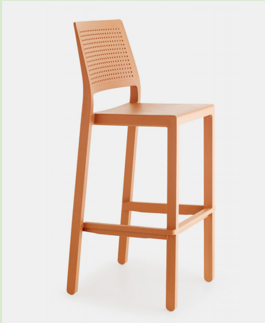
Stackable barstool Sgabello impilabile Emi, art. 2345 h.75