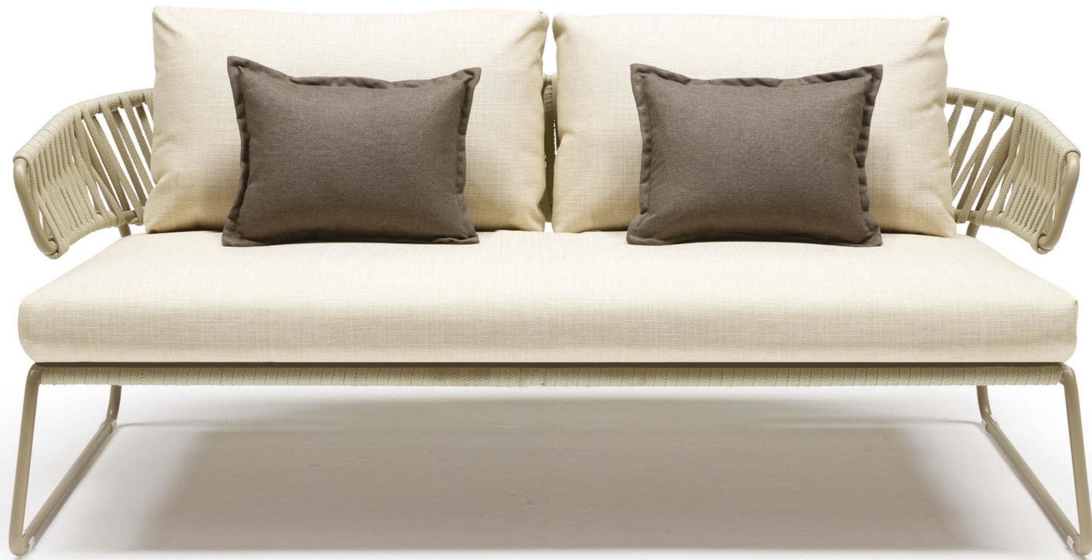
Lisa Sofa Filò, art. 2884