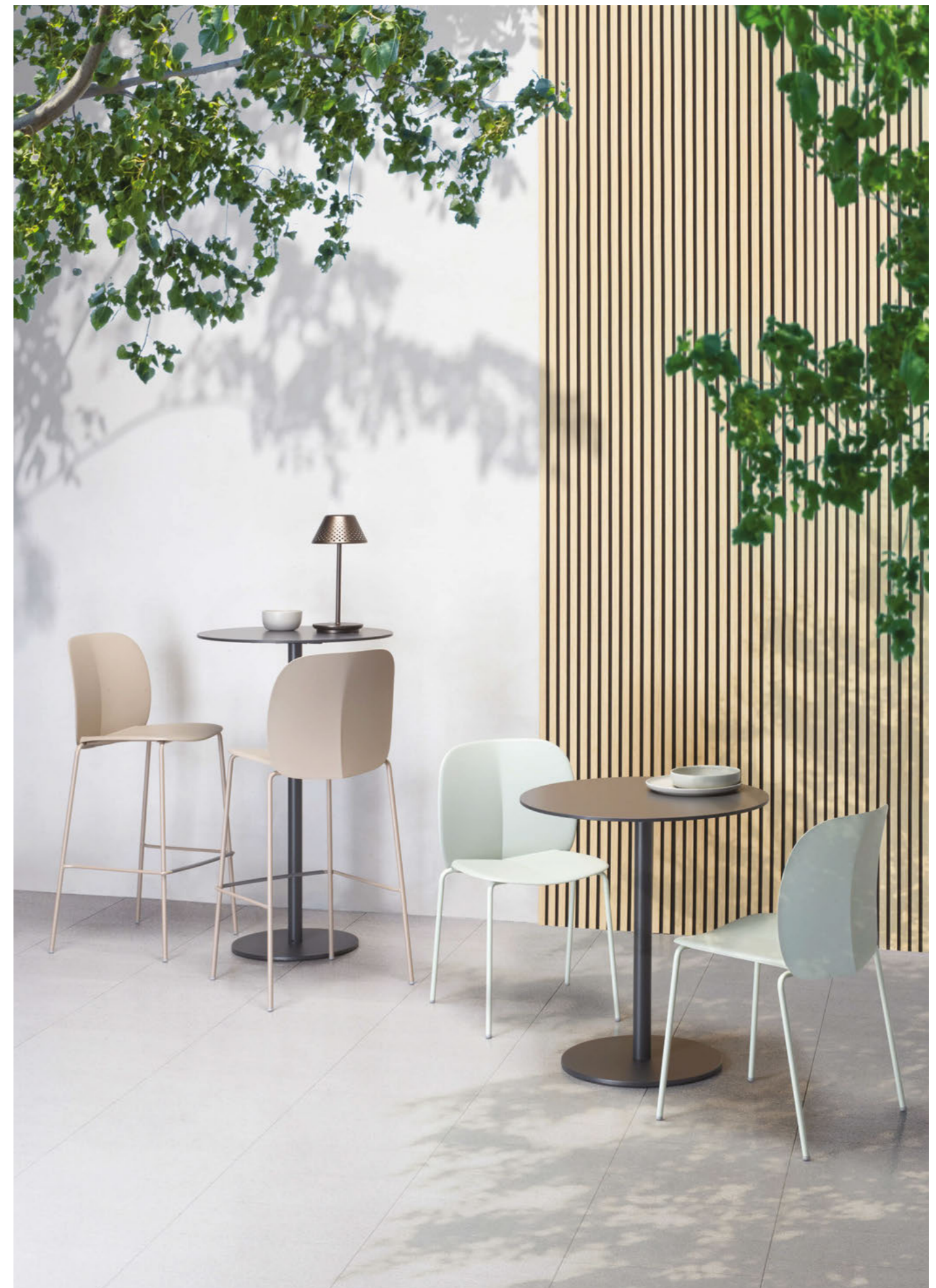
Chair Sedia Mentha, art. 2706 Barstool Sgabello Mentha, art. 2715

(En) Mentha is a cool, comfortable and cosy seat, made from certified recycled plastic. Mentha is a seating system, the shell can be paired with a variety of frames, making it a highly versatile collection. (It) Mentha è una seduta fresca, pratica, confortevole e accogliente in plastica certificata riciclata. Mentha rappresenta un sistema di sedute, la scocca viene montata su diverse tipologie di telaio: per questo è una collezione altamente versatile.