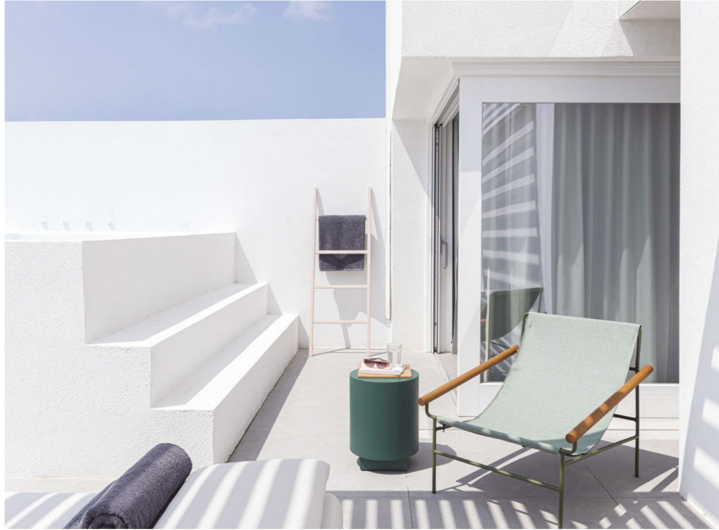
Lounge armchair Poltrona Dress_Code Smart, art. 2581