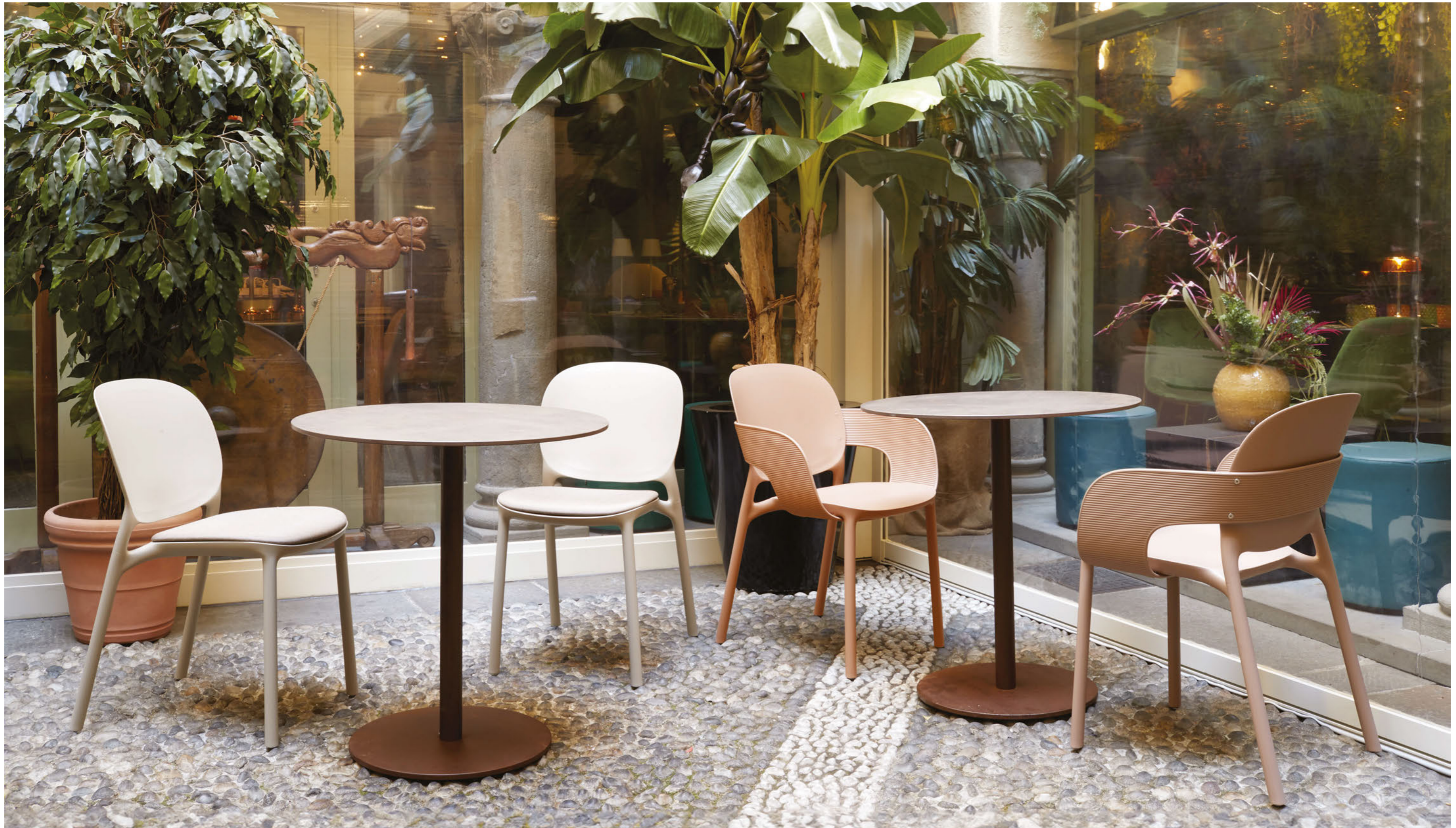
Chair Sedia Hug, art. 2381 Armchair Poltrona Hug, art. 2382 Base Tiffany, art. 5173 h. 73