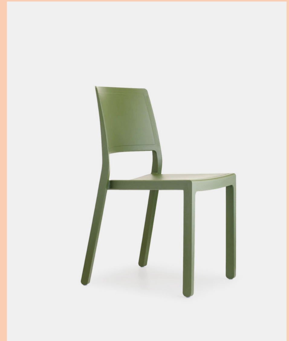
Stackable chair Sedia impilabile Kate, art. 2341