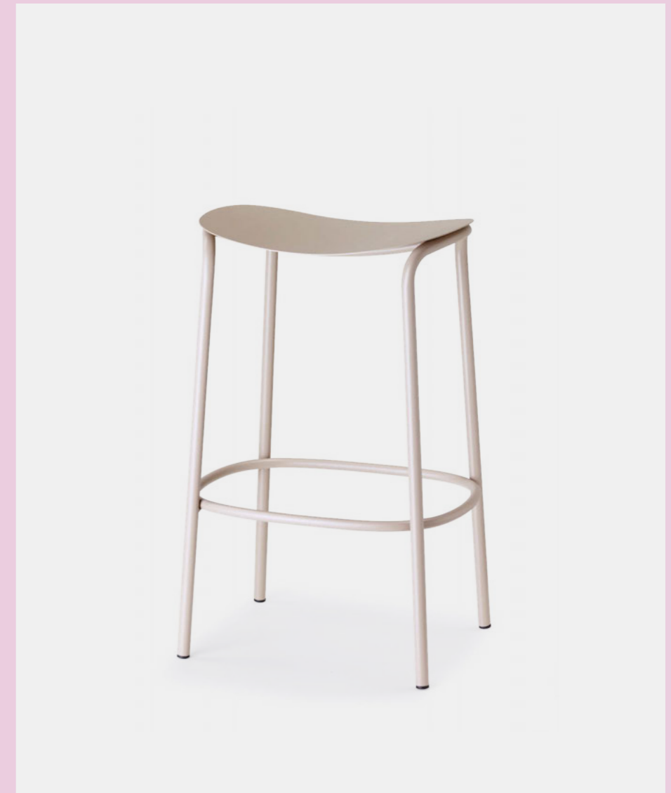
Barstool Sgabello Trick, art. 2524 h.65