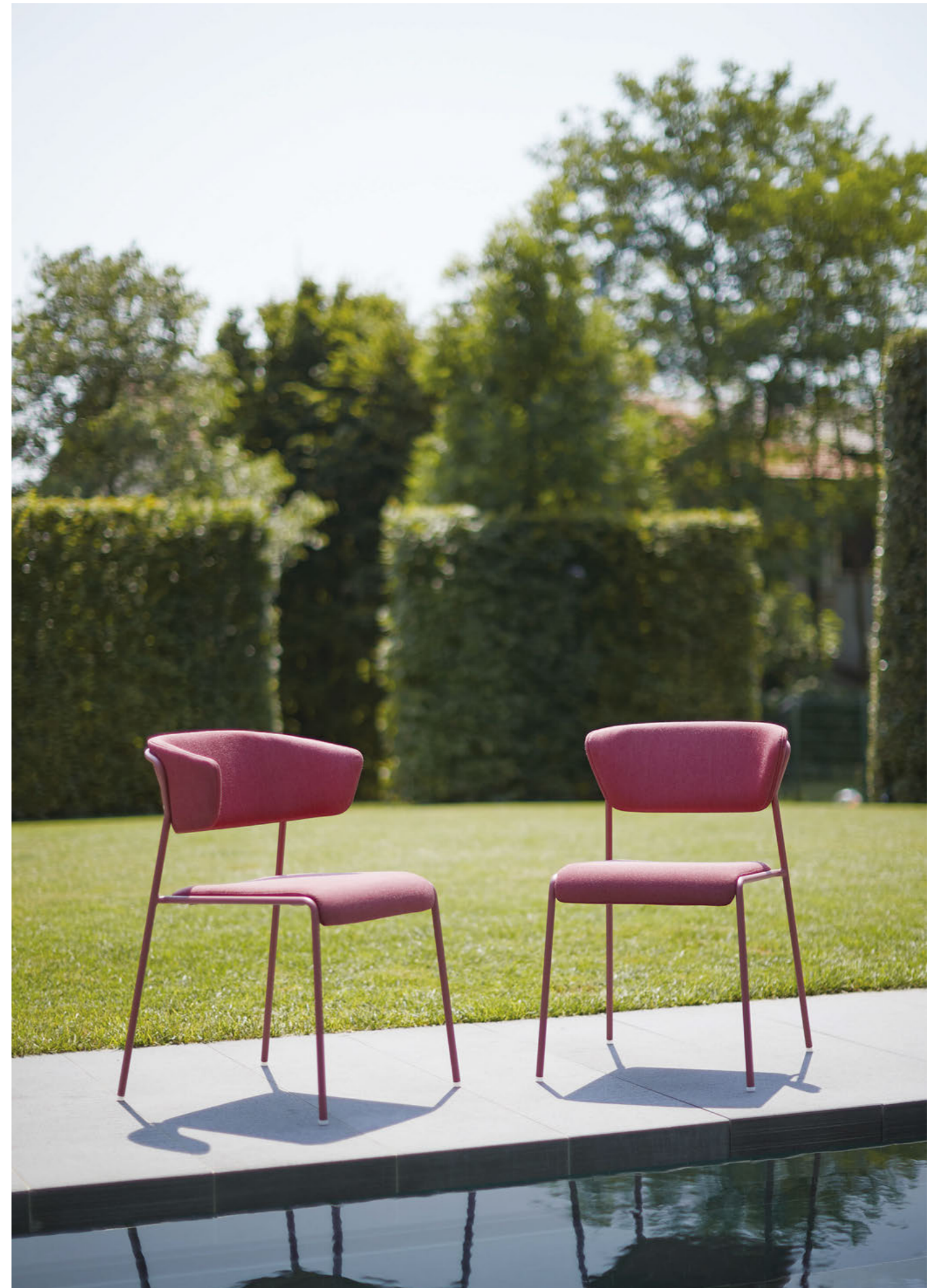
Armchair Poltrona Lisa Waterproof, art. 2860 Chair Sedia Lisa Waterproof, art. 2861