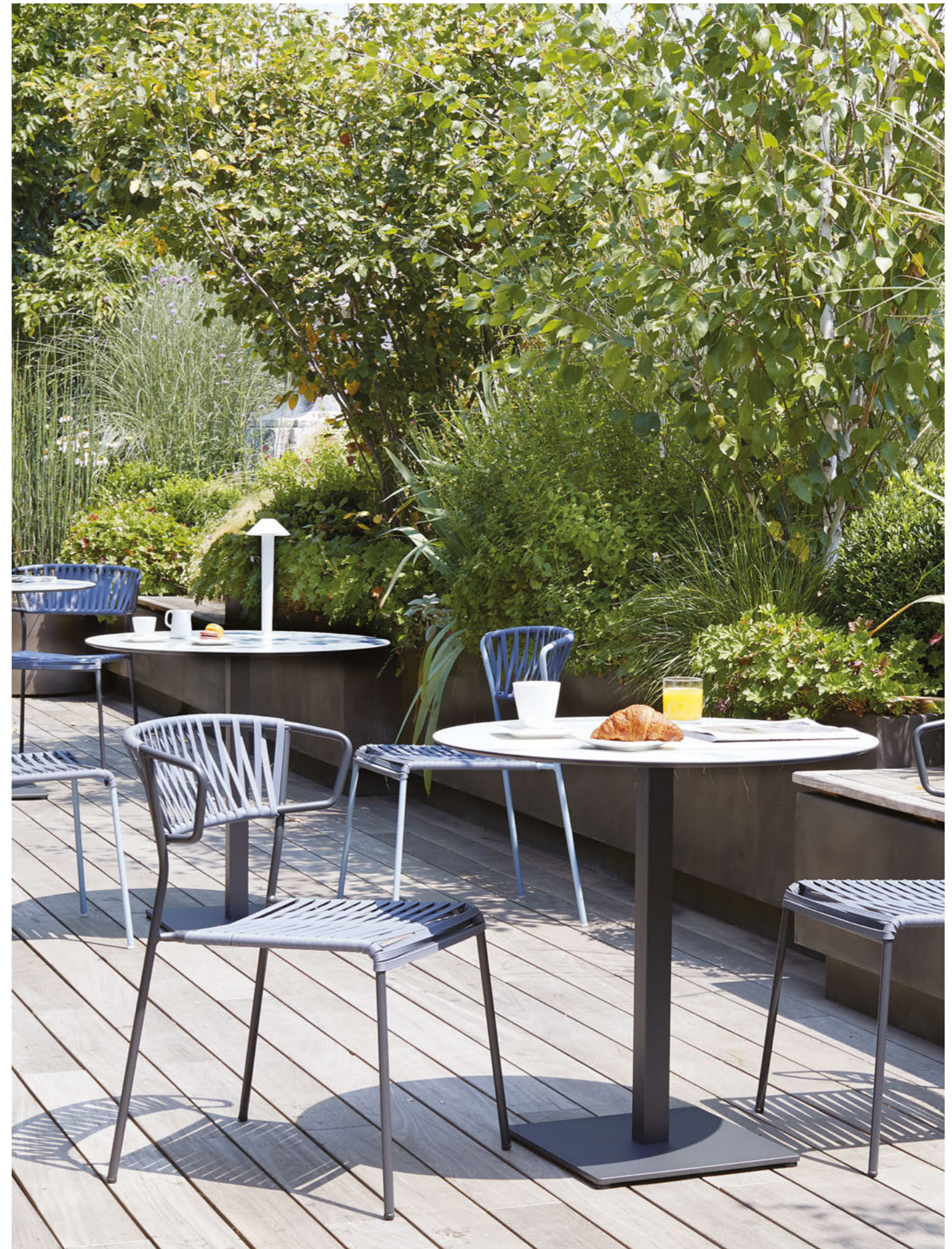
Armchair Poltrona Lisa Club, art. 2873 Chair Sedia Lisa Club, art. 2874 Base Tiffany, art. 5182

Telaio in acciaio zincato e verniciato a polvere, intreccio in estruso di PVC.