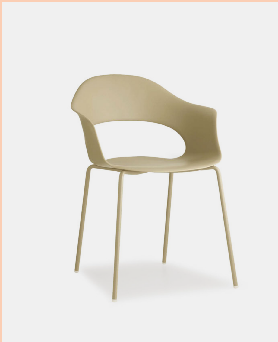
Armchair Poltrona Lady B, art. 2696

Technopolymer seat. Scocca in tecnopolimero.