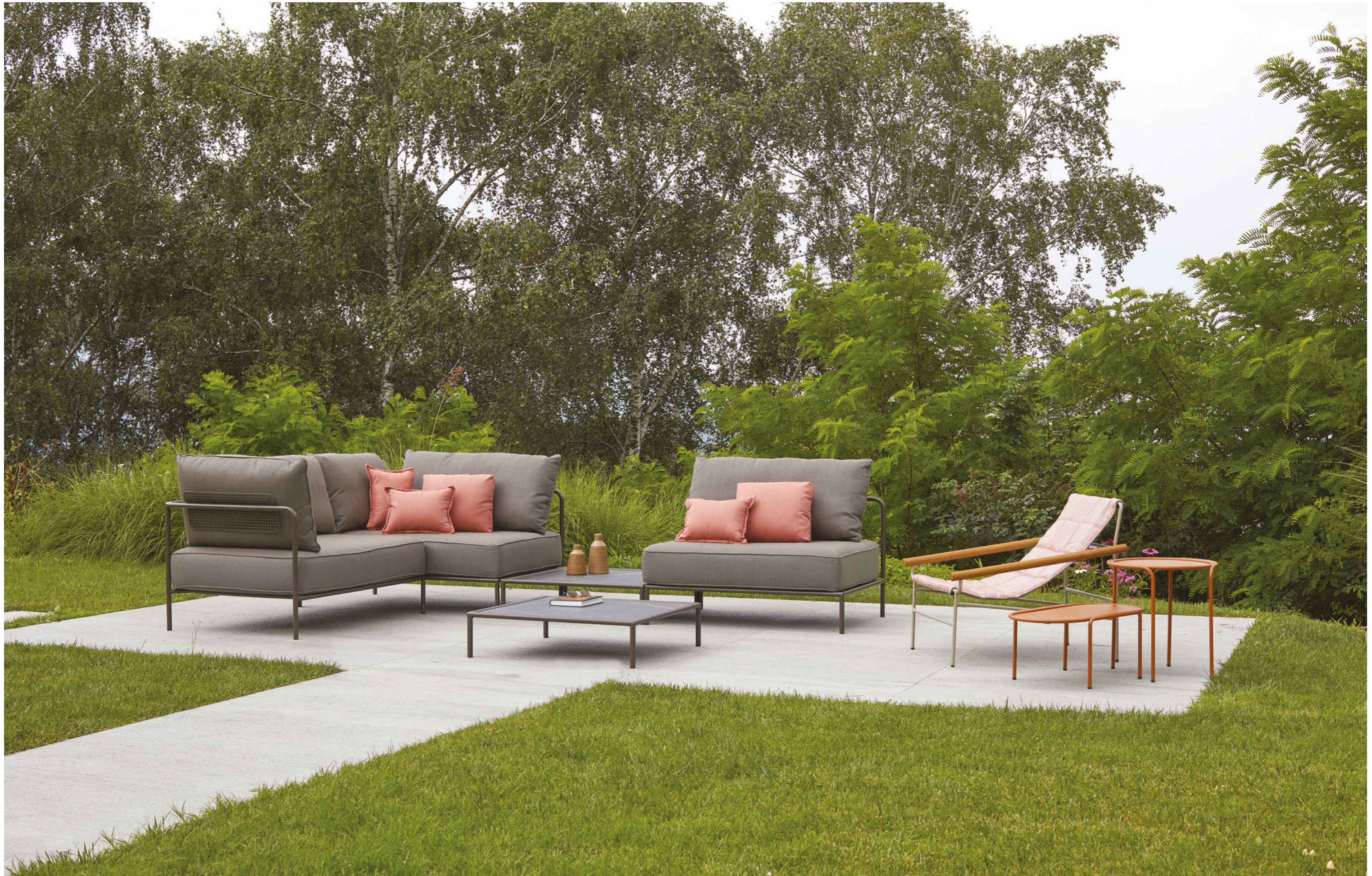
Occasional table Tavolino Flap, art. 2718 Modular system Sistema modulare Flap, art. 2887 - 2888 - 2889 - 2718 Lounge armchair Poltrona Dress_Code Glam, art. 2583