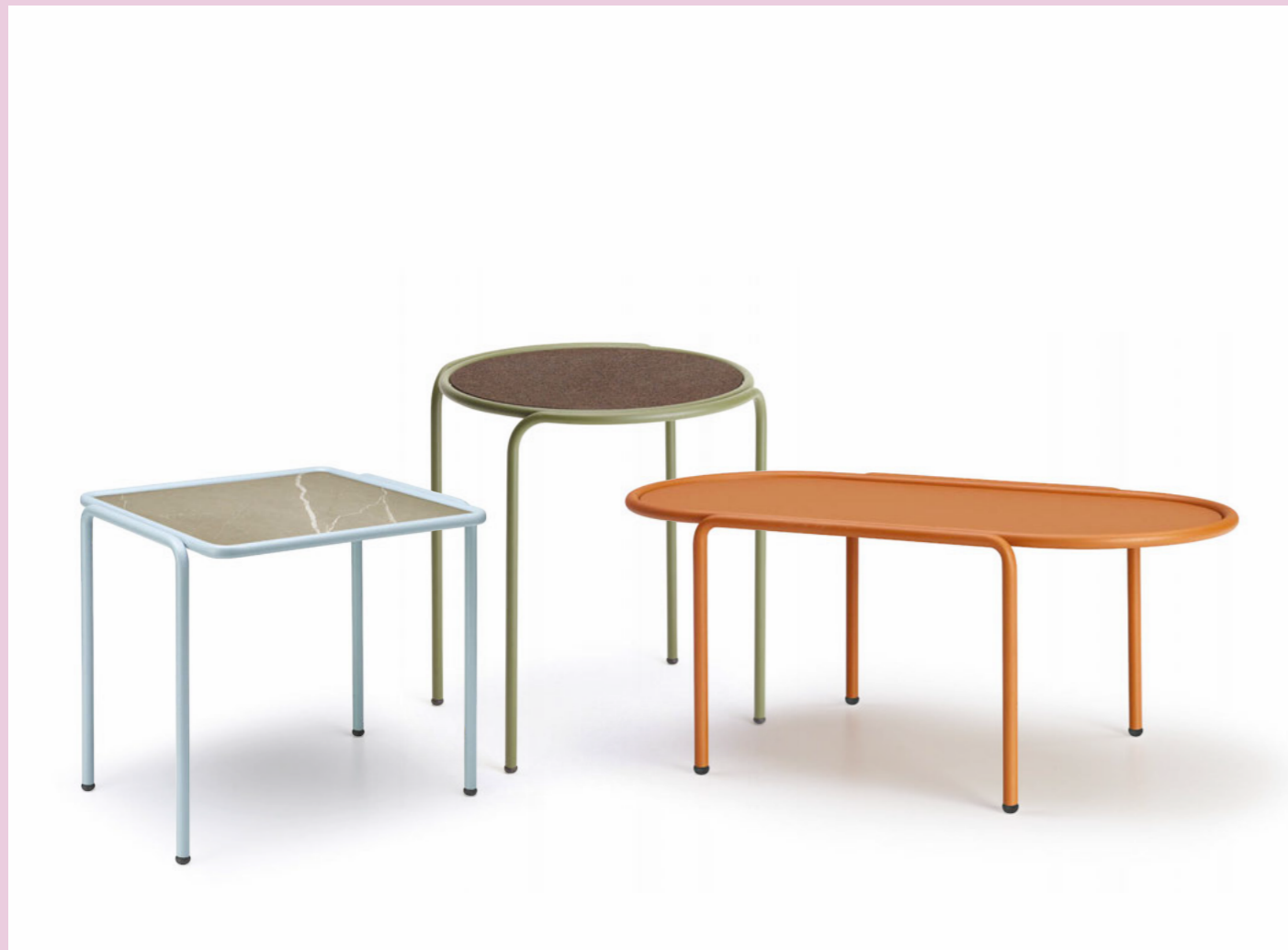
Round Coffee table rotondo Dress_Code, art. 2742 Ø 45 h.50 Oval Coffee table ovale Dress_Code, art. 2744 36x77 h.30 Square Coffee table quadrato Dress_Code, art. 2743 41x41 h.40