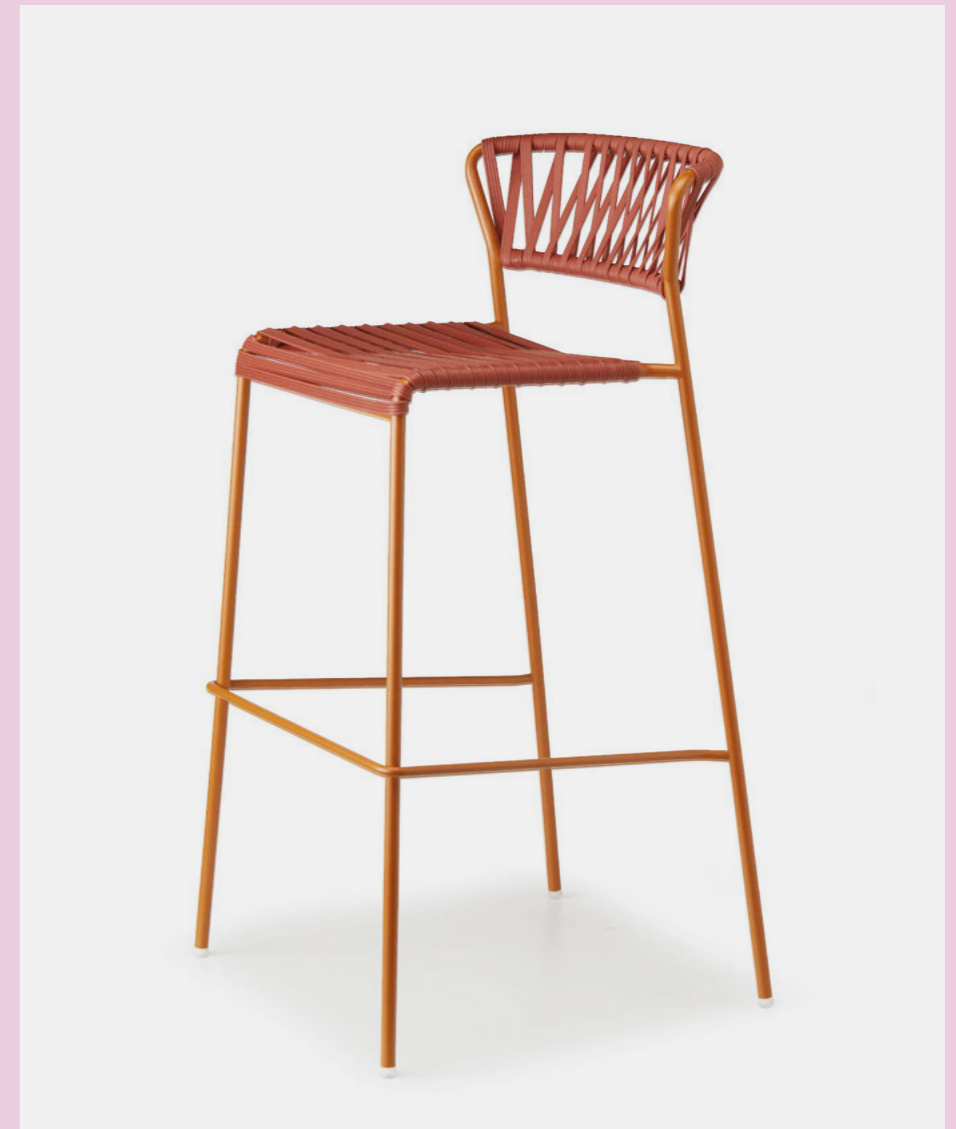
Barstool Sgabello Lisa Club, art. 2875 h.75