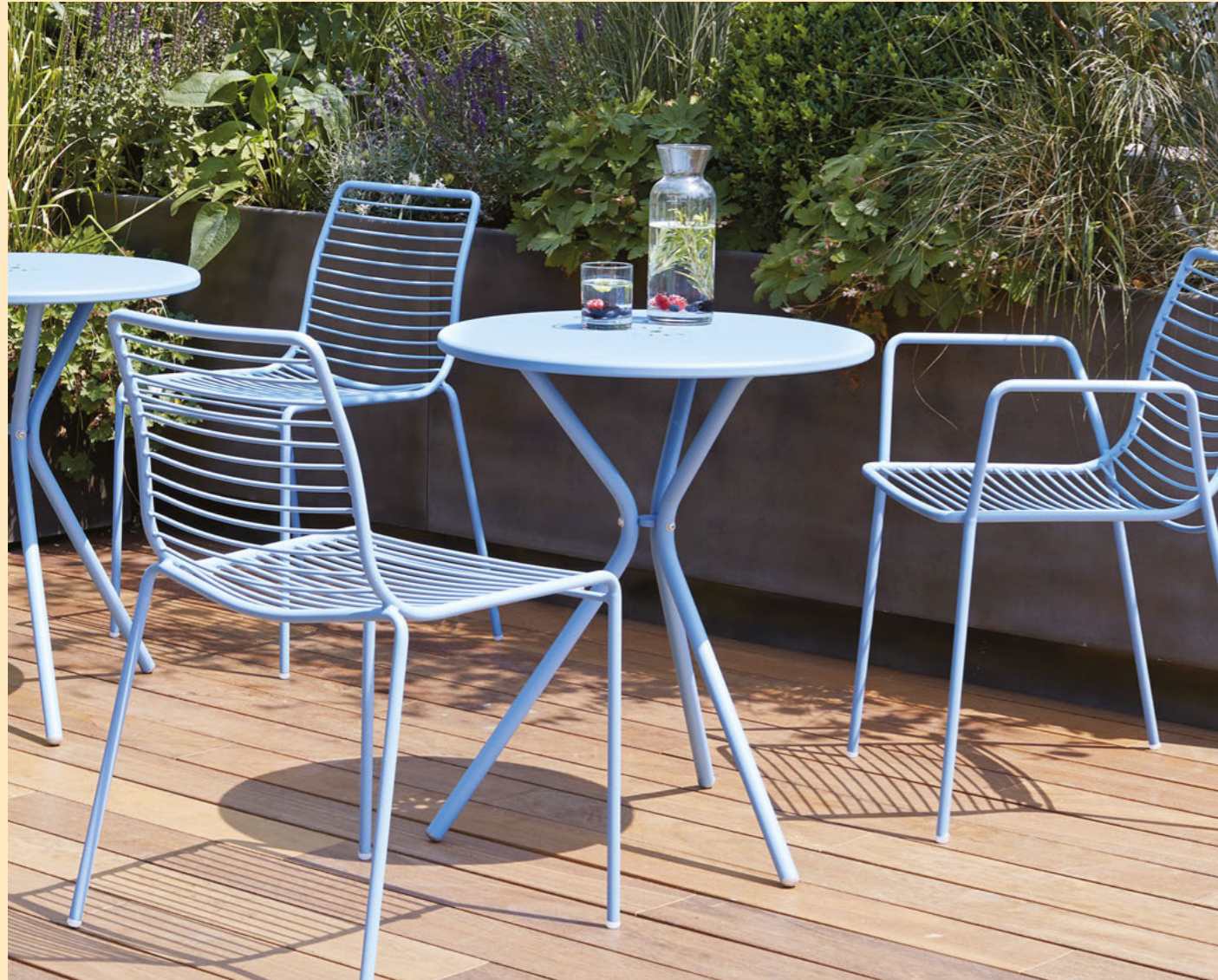
Table Tavolo Leo, art. 2719 Ø 60 h.73 Stackable chair Sedia impilabile Summer, art. 2522 Stackable armchair Poltrona impilabile Summer, art. 2520