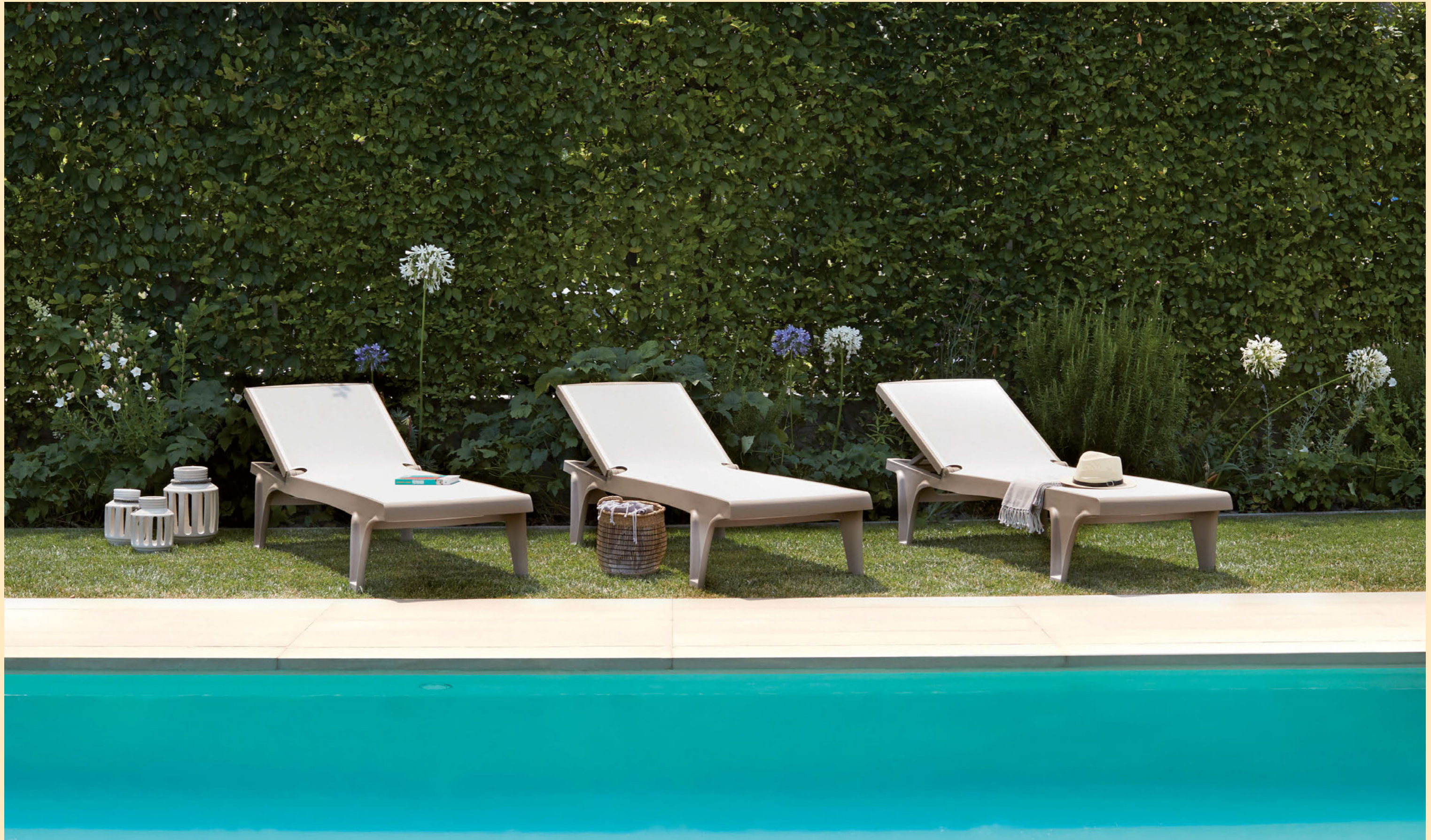
Tahiti, art. 2043

Stackable sun-bed with wheels Letino impilabile con ruote