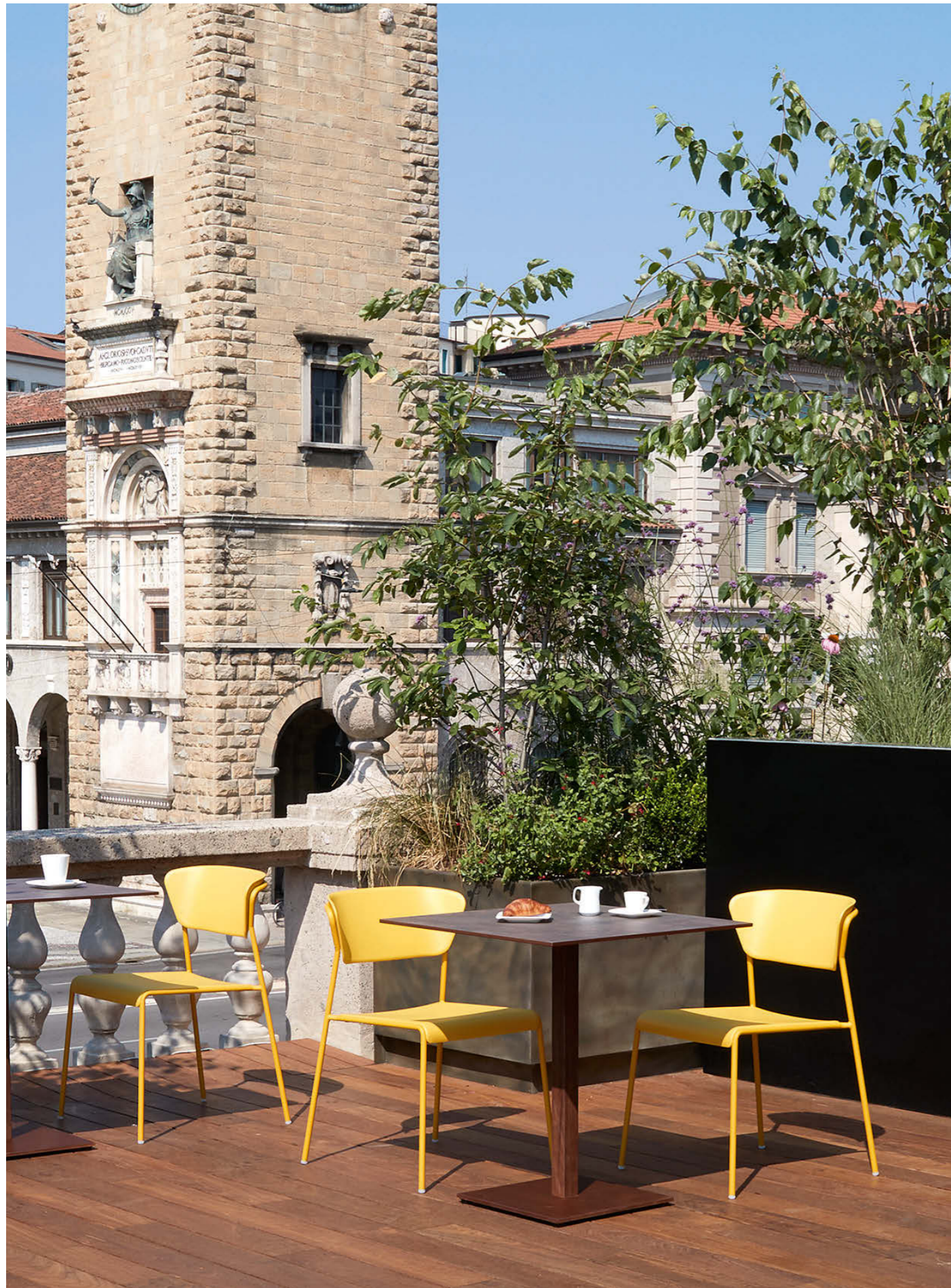
Chair Sedia Lisa Tecnopolimero, art. 2865 Base Tiffany, art. 5182

Also available in Go Green version. Disponibile anche in versione Go Green.