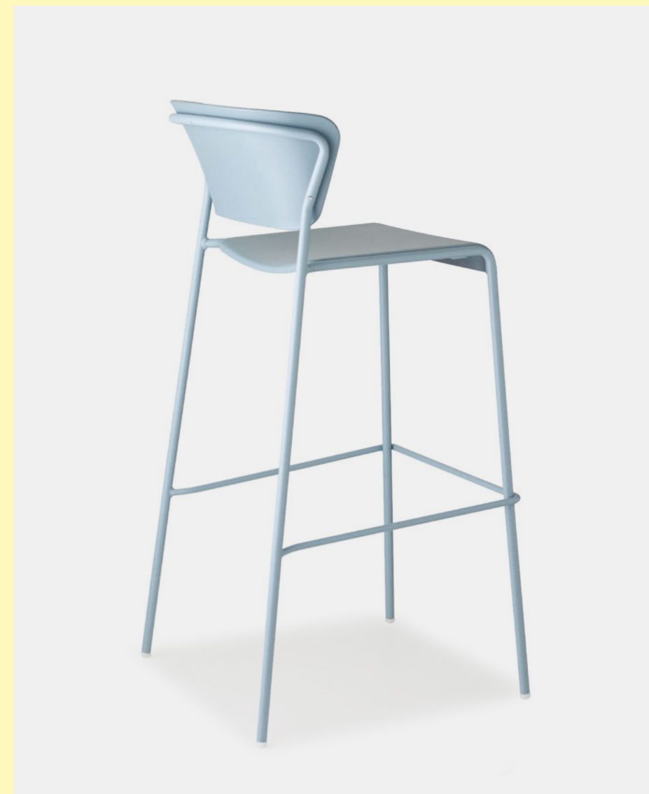
Barstool Sgabello Lisa Tecnopolimero, art. 2867 h.75