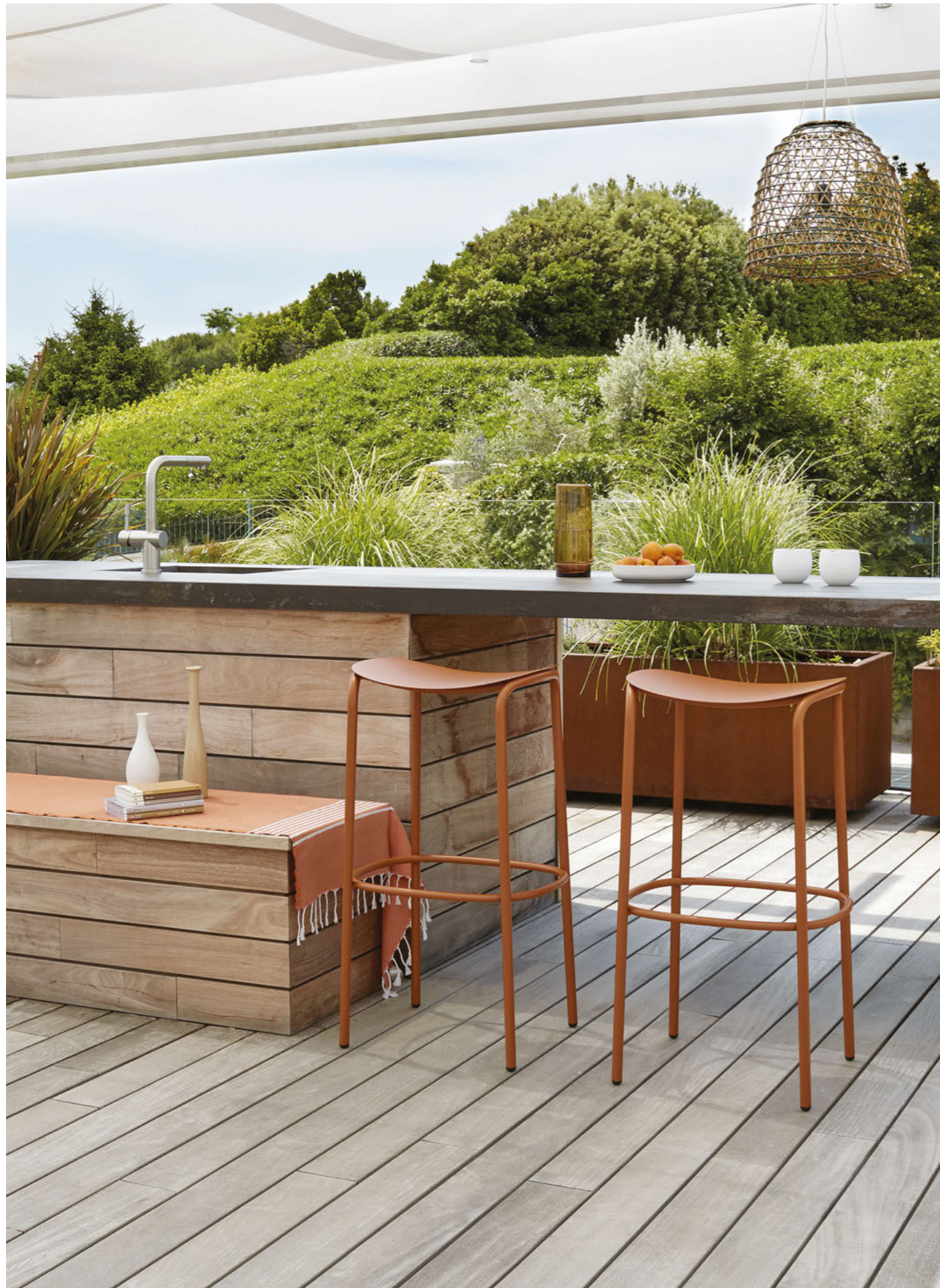
Barstool Sgabello Trick, art. 2523 h.75

Struttura in acciaio zincato e verniciato a polvere.