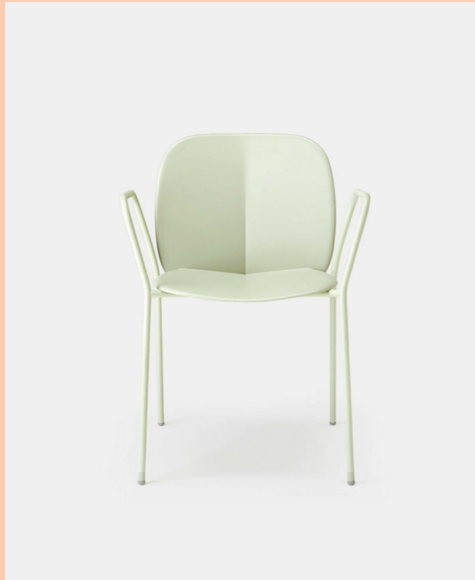
Chair Sedia Mentha, art. 2706

(En) Mentha is a cool, comfortable and cosy seat, made from certified recycled plastic. Mentha is a seating system, the shell can be paired with a variety of frames, making it a highly versatile collection. (It) Mentha è una seduta fresca, pratica, confortevole e accogliente in plastica certificata riciclata. Mentha rappresenta un sistema di sedute, la scocca viene montata su diverse tipologie di telaio: per questo è una collezione altamente versatile.