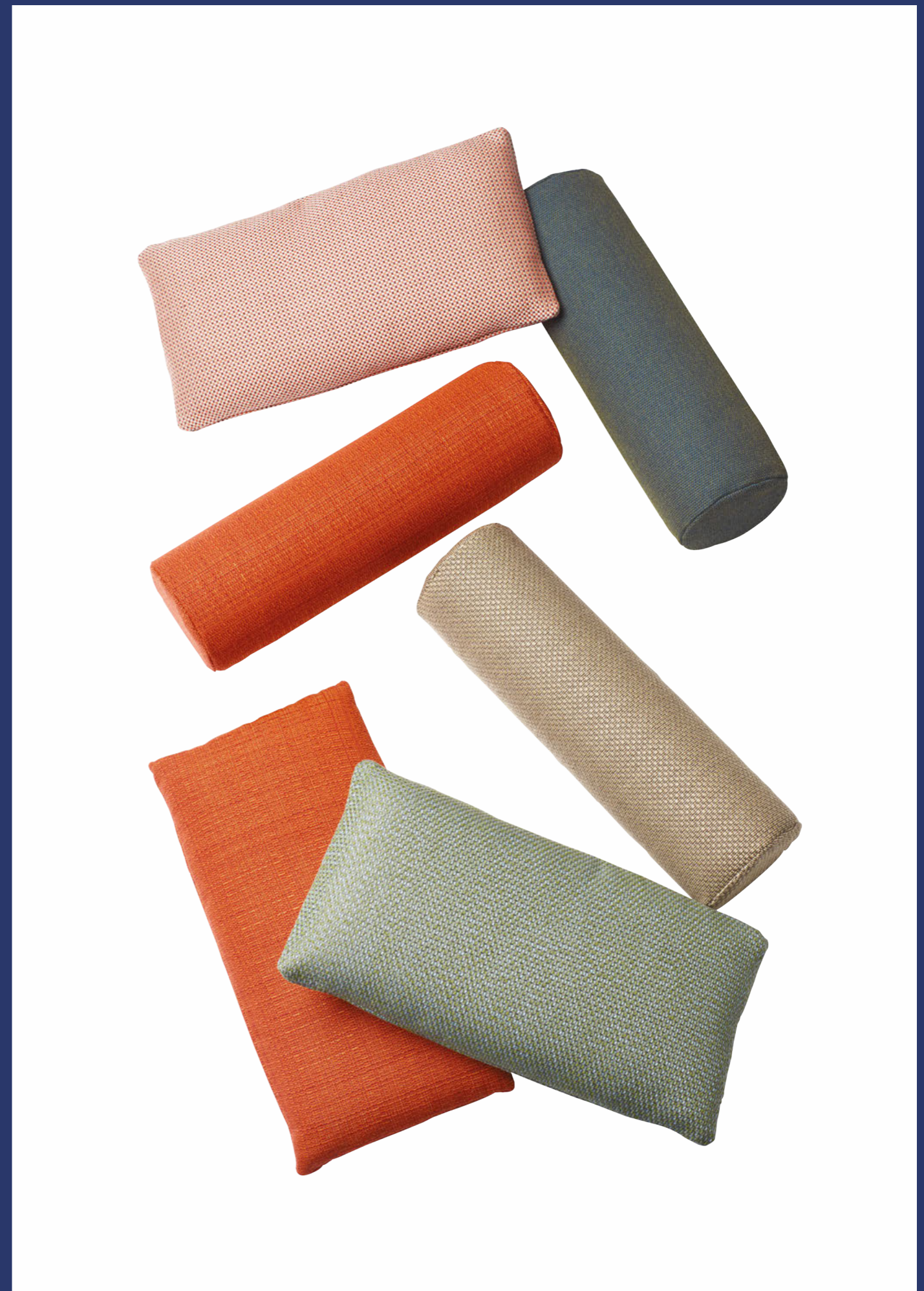
Headrest cushions Cuscini poggiatesta Dress_Code, art. 1560, art. 1561