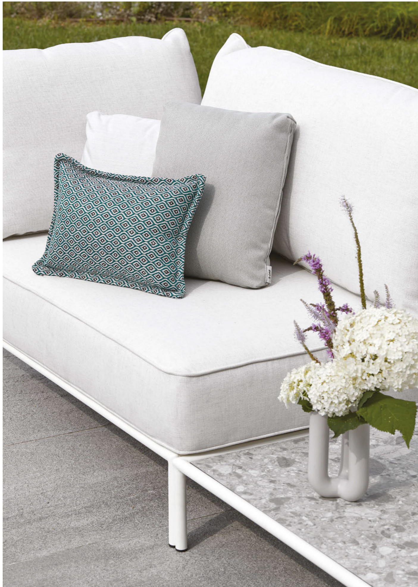
Occasional table Tavolino Flap, art. 2718 Modular system Sistema modulare Flap, art. 2887