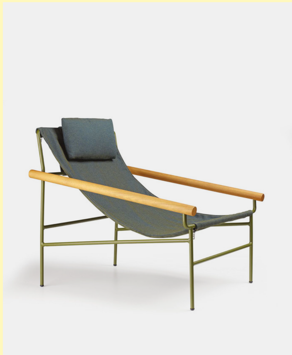
Lounge armchair Poltrona Dress_Code Smart, art. 2581

(En) The new headrest cushions fix directly to the frame of the armchair and are made with the same coordinated fabrics of the chair's padding. (It) I nuovi cuscini poggiatesta si fissano direttamente al telaio della poltrona e sono realizzati nei tessuti coordinati ai rivestimenti delle lounge.