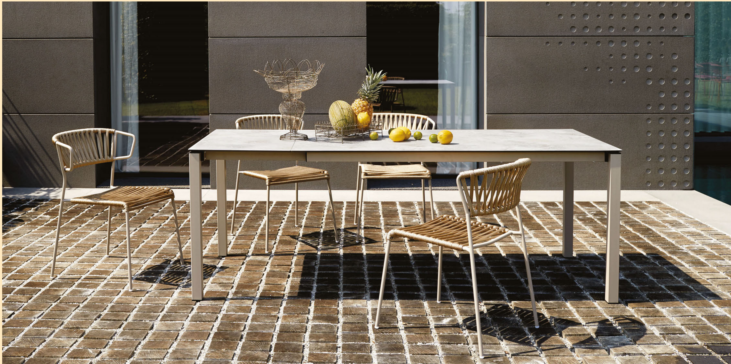
Extendable table Tavolo Pranzo Allungabile 160/210, art. 2418 h.75