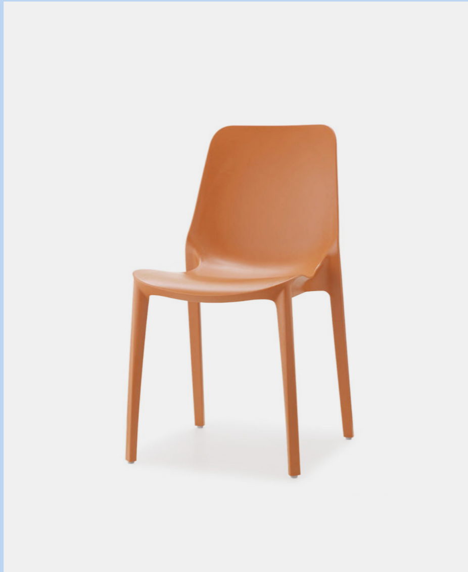
Stackable chair Sedia impilabile Ginevra, art. 2334

Also available in Go Green version. Disponibile anche in versione Go Green.