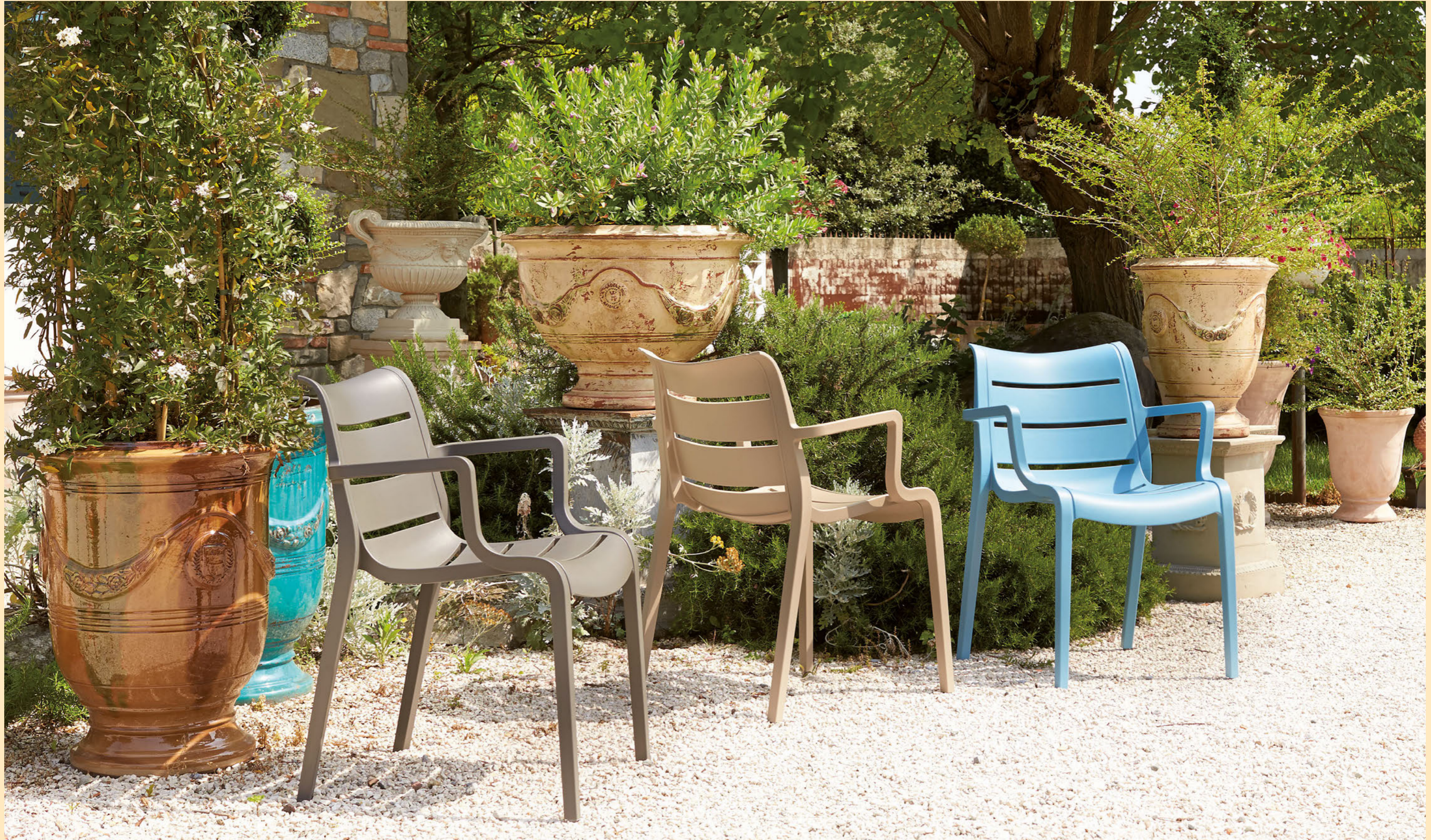
Stackable armchair Poltrona impilabile Sunset, art. 2329