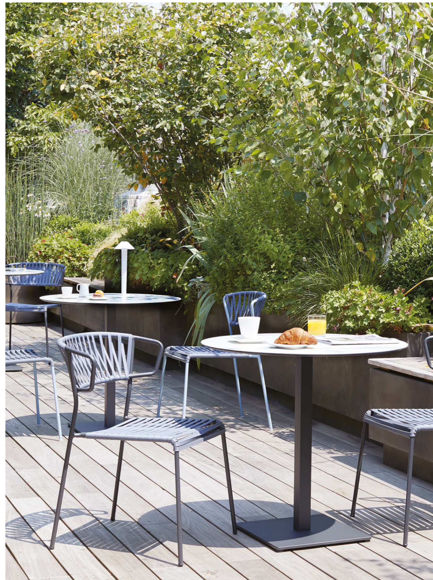
Armchair Poltrona Lisa Club, art. 2873 Chair Sedia Lisa Club, art. 2874 Base Tiffany, art. 5182

Telaio in acciaio zincato e verniciato a polvere, intreccio in estruso di PVC.